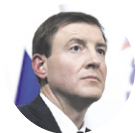
АНДРЕЙ ТУРЧАК заместитель председателя Совета Федерации, секретарь Генерального совета партии «Единая Россия»:

1 150 000 рублей, если первый ребёнок родился после 1 января 2020 года 2 идёт на оплату ипотеки