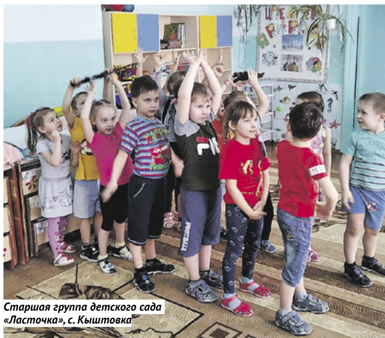
Старшая группа детского сада «Ласточка», с. Кыштовка