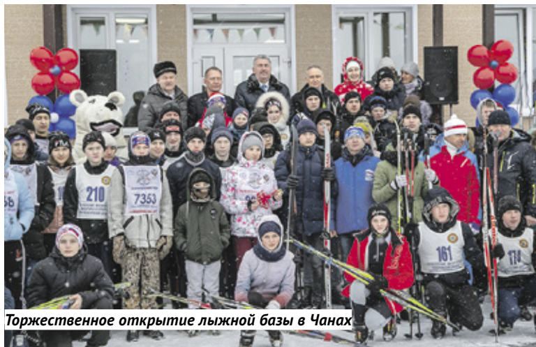
Торжественное открытие лыжной базы в Чаных

Лыжная база открылась в рабочем посёлке Чаны, со временем здесь появится целый спортивный комплекс.