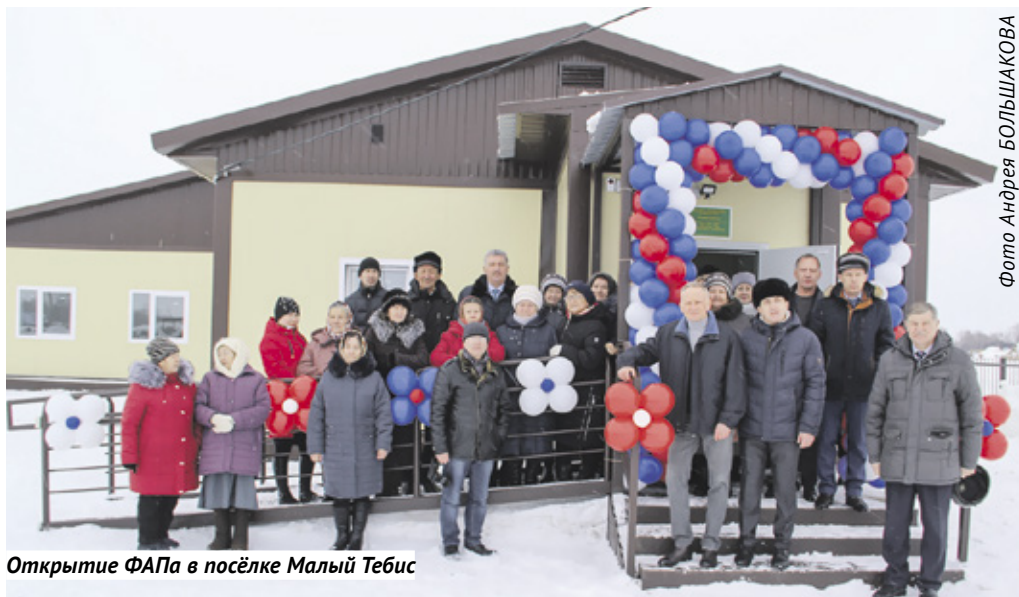
Открытие ФАПа в посёлке Малый Тебис

— В Малом Тебисе в здании ФАПа трещина зияла толщиной с кулак, к нам обратились жители, мы обсуждали этот вопрос на выездном заседании комитета заксобраний,