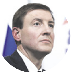
АНДРЕЙ ТУРЧАК заместитель председателя Совета Федерации, секретарь Генерального совета партии «Единая Россия»: