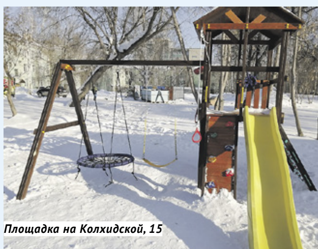
Площадка на Колхидской, 15