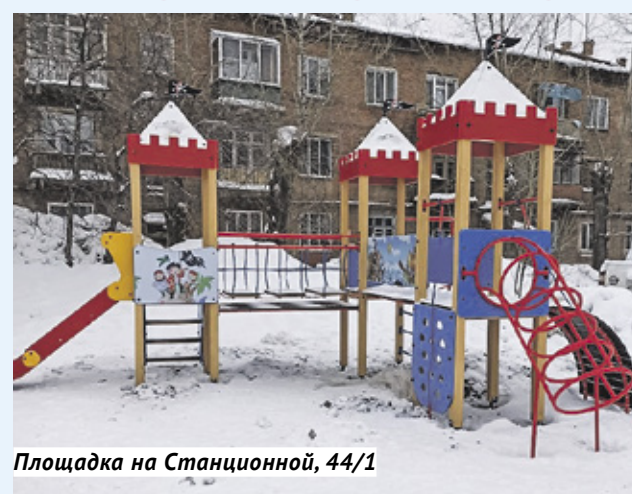
Площадка на Станционной, 44/1