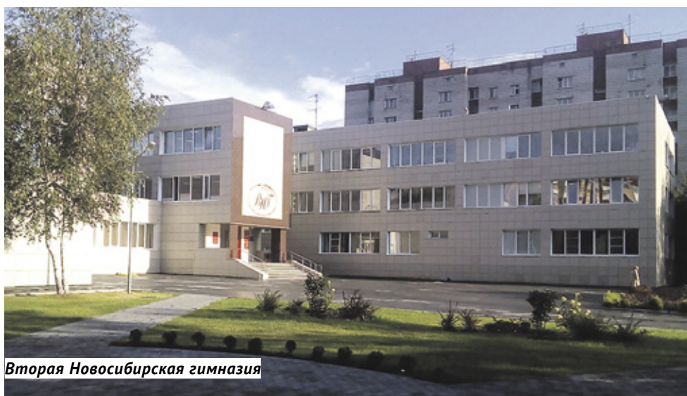
Вторая Новосибирская гимназия