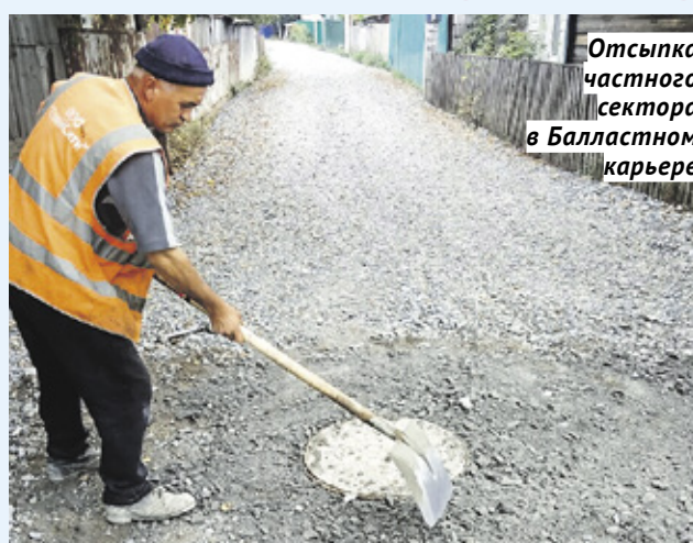
Отсыпка частного сектора в Балластном карьере