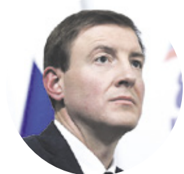
АНДРЕЙ ТУРЧАК заместитель председателя Совета Федерации, секретарь Генерального совета партии «Единая Россия»:

1 150 000 рублей, если первый ребёнок родился после 1 января 2020 года 2 идёт на оплату ипотеки