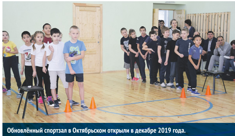
Обновлённый спортзал в Октябрьском открыли в декабре 2019 года.

В 2019 году Октябрьская средняя школа Карасукского района шагнула в своё шестое десятилетие. За 50 лет многое в здании ремонтировалось, вот потребовался ремонт и спортивному залу. Большая часть средств пришла по областной программе с софинансированием федерального и местного бюджетов. А недостающие средства для завершения капремонта (около 330 тыс.