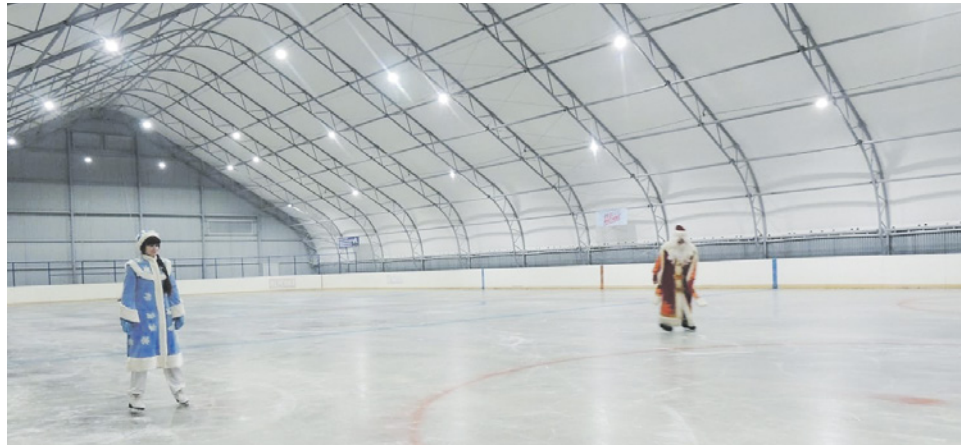
В Краснозёрском был выполнен наказ по строительству ангара для хоккейной коробки.

— Суммарно все депутаты заксобрании взяли наказов на 150 миллиардов рублей. Недавно на одном рабочем совещании было сказано, что исполнение по итогам нынешнего созыва Законодательного собрания выльется в сумму около 60 миллиардов — чуть более трети наказов, — объясняет депутат. — Какие-то крупные наказания, такие как строительство школ, спорткомплексов, масштабных дорожных объектов будут начаты в нынешнем, шестом созыве, но закончены, введены в эксплуатацию, будут уже в следующем созыве. По факту — наказ не будет выполнен, но людей же не обманешь: они видят, что дело продвигается, их просьбы не забыты. Оптимизм вселяет и тот факт, что в прошлом году началась реализация нацпроектов, с помощью которых по области удастся сделать много хороших дел. Также большим подспорьем являются и приоритетные проекты партии «Единая Россия», реализуемые уже несколько лет. Особенно по таким направлениям как сельская культура, безопас-