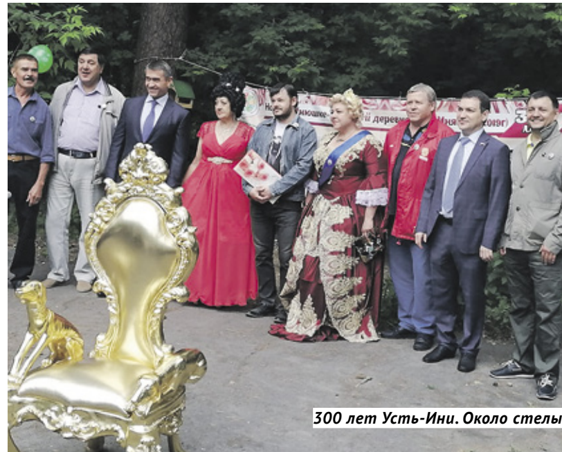
300 лет Усть-Ини. Около стелы.