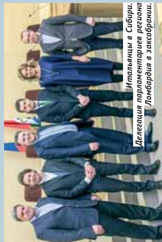
Делегация парламентариев региона Итальянцы в Сибири. Делегация парламентариев региона Ломбардия в Законодательном Собрании.