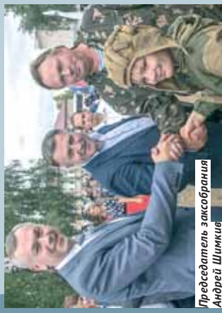
Председатель Законодательного Собрания Андрей Шимкив с губернатором Новосибирской области Андреем Травниковым.