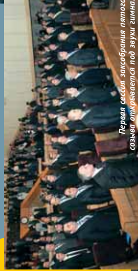
Первая сессия Законодательного Собрания пятую созыва открывается под звуки гимна.