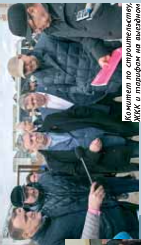
Комитет по строительству ЖКК и тарифам на выездном заседании в Кубышевске.

76 депутатов по партийным спискам, 38 — по одномандатным округам