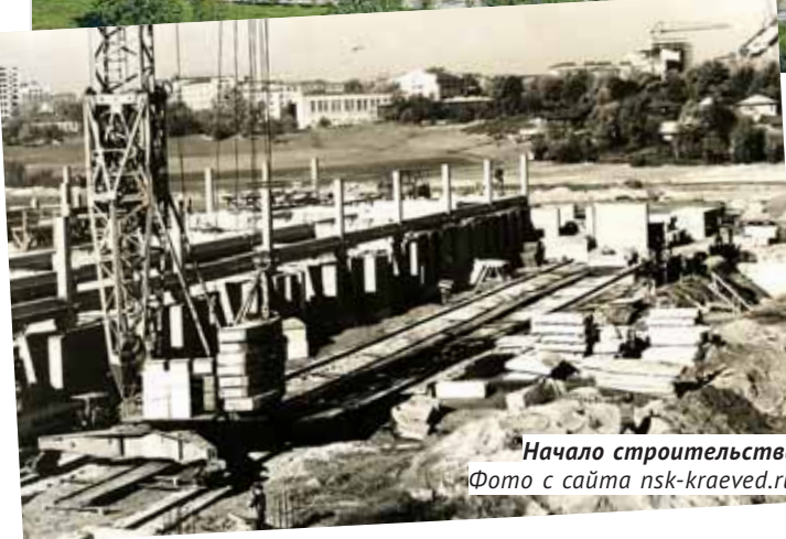
Начало строительства.

До сих пор ещё можно услышать рассуждения, что станции метро «Октябрьская» могло и не быть: если бы не строительство здесь здания для обкома КПСС, подземка протянулась бы к самому началу Красного проспекта и прошла через автовокзал. На самом деле планы по продолжению центра города в Октябрьском районе вынашивались ещё в 1930-е годы. Однако продвинуться в этом направлении смогли только в 1960-е, когда было принято решение о строительстве нового здания для Новосибирского обкома КПСС, располагавшегося тогда на Красном проспекте, 5, где сегодня размещён Художественный музей.