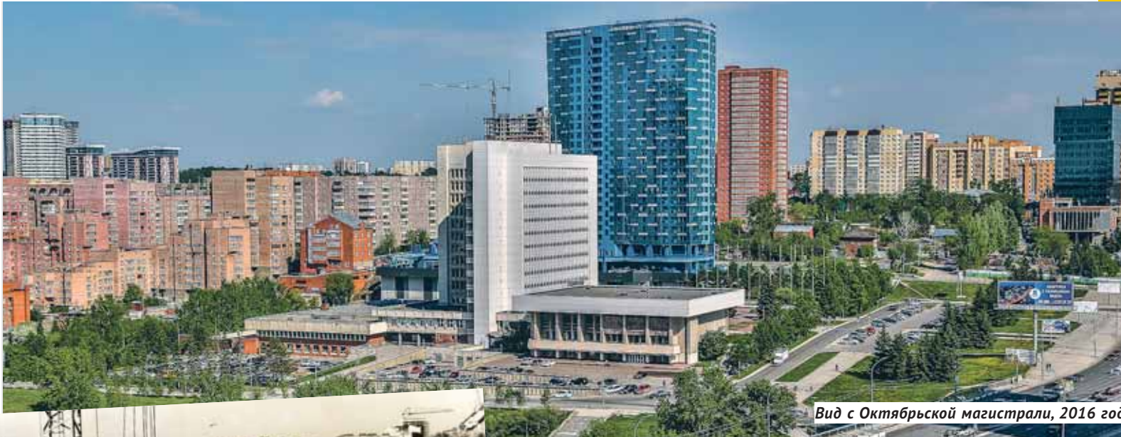
Вид с Октябрьской магистрали, 2016 год.

Новосибирский областной Совет депутатов, сегодня Законодательное собрание, получил «прописку» на Кирова, 3, в ноябре 1991 года, но строилось это здание для других целей.