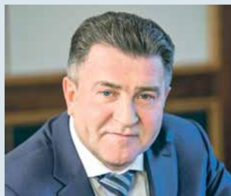
Председатель Законодательного Собрания Новосибирской области Андрей ШИМКИВ