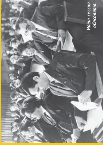
Идёт сессия областного правительства.

Проведено 37 сессий, принято 694 нормативных правовых акта, из них 75 законов.