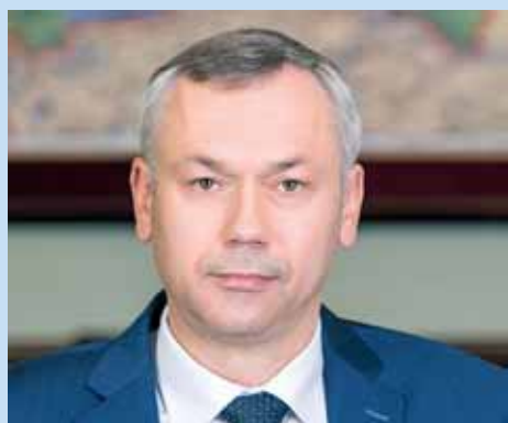
Губернатор Новосибирской области Андрей ТРАВНИКОВ