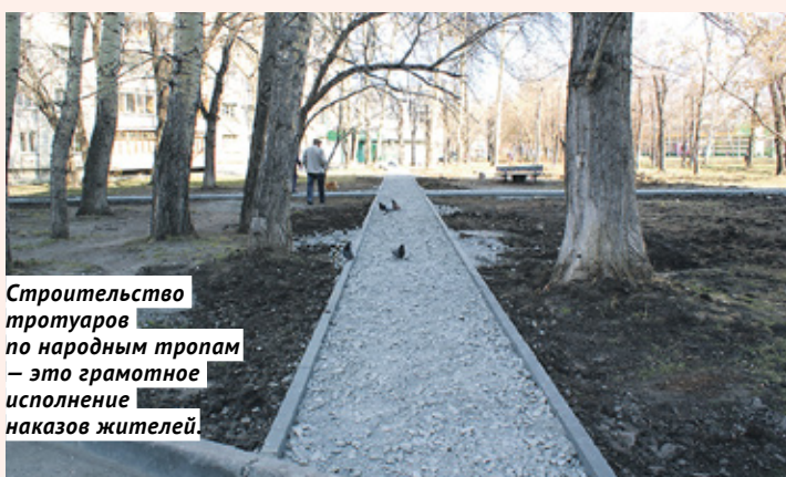
Строительство тротуаров по народным тропам — это грамотное исполнение указов жителей.