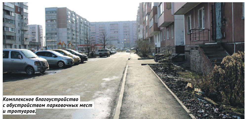
Комплексное благоустройство с обустройством парковочных мест и тротуаров.

— Мы планируем в 2020 году начать и завершить первый этап Дисперсного парка: это благоустройство территории за кинотеатром «Рассвет» и городка аттракционов, освещение всей парковой части,