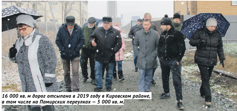
16 000 кв. м дорог отсыпано в 2019 году в Кировском районе, в том числе на Памирских переулках — 5 000 кв. м.

— Центр подготовки по спортивной гимнастике имени Евгения Подгорного, о котором вы говорите, открылся год назад. Много ли желающих заниматься?