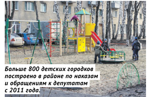
Больше 800 детских городков построено в районе по указам и обращениям к депутатам с 2011 года.

— Особую гордость вызывает то, как люди стали относиться к своим дворам. Активно принимают участие в обсуждении проектов благоустройства и конт-