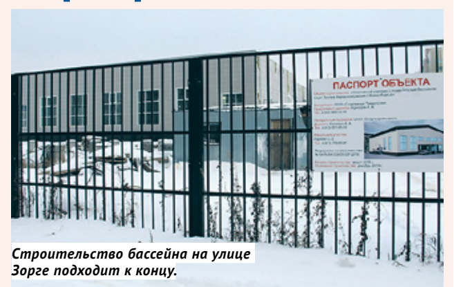
Строительство бассейна на улице Зорге подходит к концу.