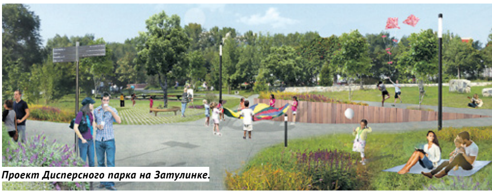
Проект Дисперсного парка на Затулинке.