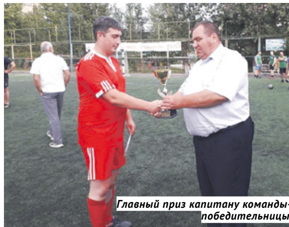
Главный приз капитану команды-победительницы.

Чемпионат проходил в два круга, до августа, и участие в нём принимали шесть городских команд: «Спартак», «Локомотив», «Толстяк», «Ветеран», «Пограничник» и коллектив, представляющий Центральную районную больницу, — «Медик». Именно в первом матче со «Спартаком», выигранном со счётом 4:1, медики, как выяснилось, и заложили фундамент будущего успеха в турнире. Так сложилось, что последний матч чемпионата также прошёл с участием «Медика», который был сильнее железнодорожников и официально оформил победу.