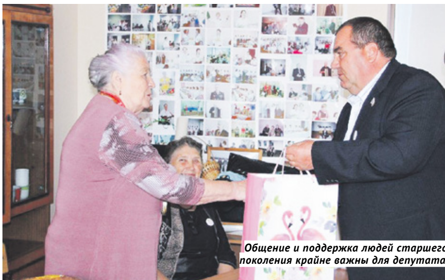
Общение и поддержка людей старшего поколения крайне важны для депутата.

В августе в Карасукском районе, на базе оздоровительного лагеря «Лес-