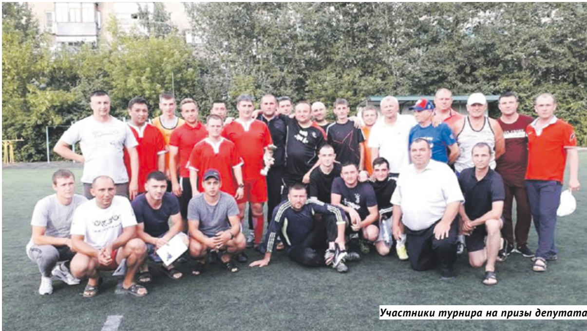
Участники турнира на призы депутата.