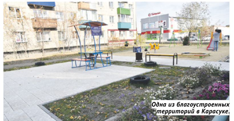
Одна из благоустроенных территорий в Карасуке.

Всё лето и часть осени в Карасуке шли масштабные благоустроительные работы. Особое внимание было приковано к главному для горожан месту отдыха — Центральному парку Карасука, работы в котором поэтапно проводились с 2017 года в рамках национального проекта «Жильё и городская среда». Суммарно на благоустройство парка было выделено 33 миллиона рублей из федерального и областного бюджетов, в том числе 18 миллионов рублей в 2019 году. В этом году были обустроены парковка, велосипедные дорожки, перенесено ограждение, произведён монтаж игровых комплексов, установлены ворота сценического комплекса, проведено озеленение. Кроме того, в том числе и за счёт средств местного бюджета, был оборудован каток и облагорожена прилегающая к нему территория.