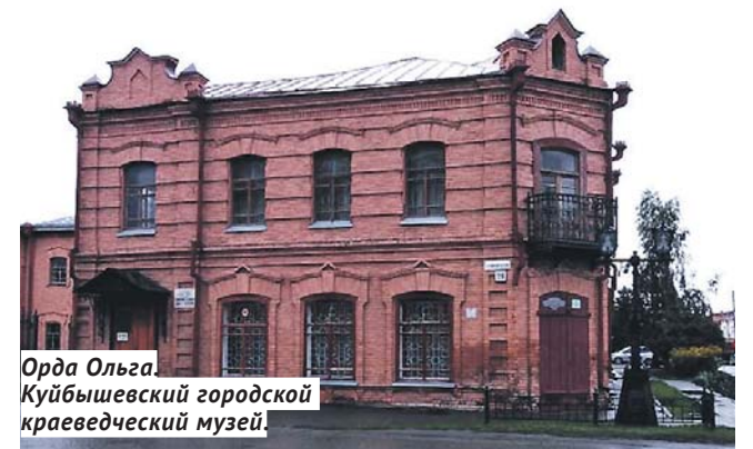
Орда Ольга. Куйбышевский городской краеведческий музей.

Курорт федерального значения посёлке «Озеро Карачи», основанный в 1880 году, по праву считается жемчужиной Сибири. Уникальность этого курорта — в пяти природных лечебных факторах: сульфидно-иловая грязь, рапа, минеральная вода «Карачинская», йодобромная минеральная вода и