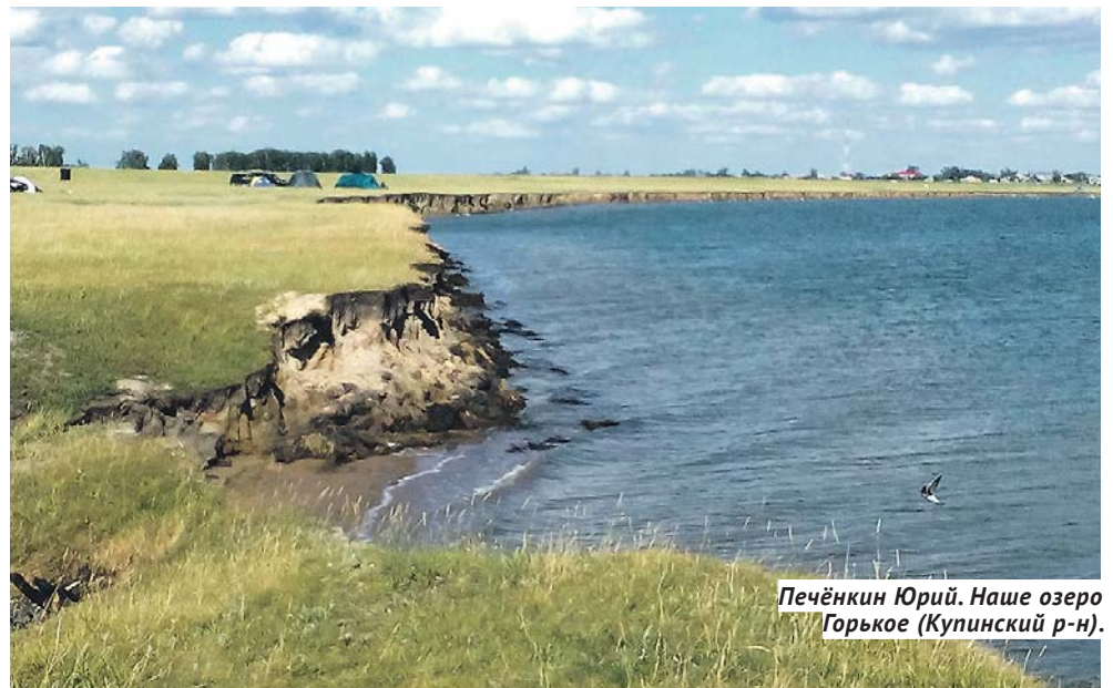
Печёнкин Юрий. Наше озеро Горькое (Купинский р-н).

Сегодня в Новосибирской области насчитывается более 2 000 объектов культурного наследия федерального, регионального и местного значения.