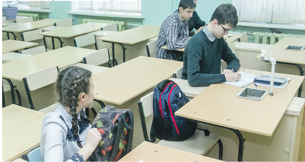
Новая мебель в кабинетах школы №128 — подарок от депутата Оксаны Марченко.