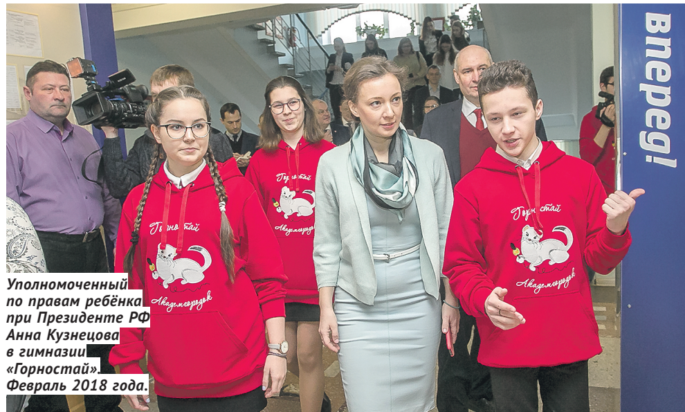
Уполномоченный по правам ребёнка при Президенте РФ Анна Кузнецова в гимназии «Горностаи». Февраль 2018 года.

В 2010 году в Новосибирской области стартовала программа, аналогов которой прежде не было, — «Школьное окно». За три года из бюджетов областного и муниципального уровней было выделено почти 800 миллионов рублей, на которые в школах заменили 52 тысячи оконных блоков — установив пластиковые стеклопакеты вместо деревянных. В итоге школы (в основном в сельской местности) не только приобрели современный вид, но и стали теплее. Обновления требовали гораздо больше окон, но после 2013 года программа была свёрнута и только в 2017 году снова появилась в областном бюджете. Схожая «биография» и у программы «Школьная кровля».