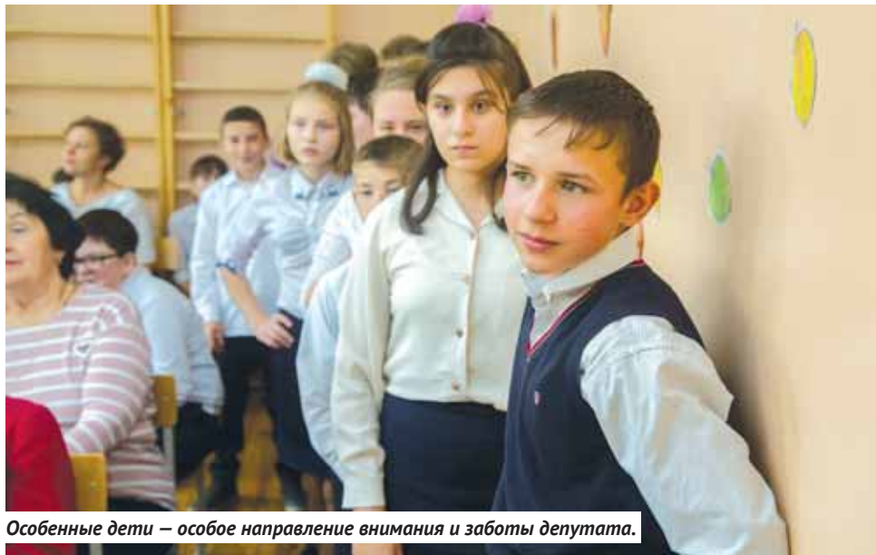
Особенные дети — особое направление внимания и заботы депутата.