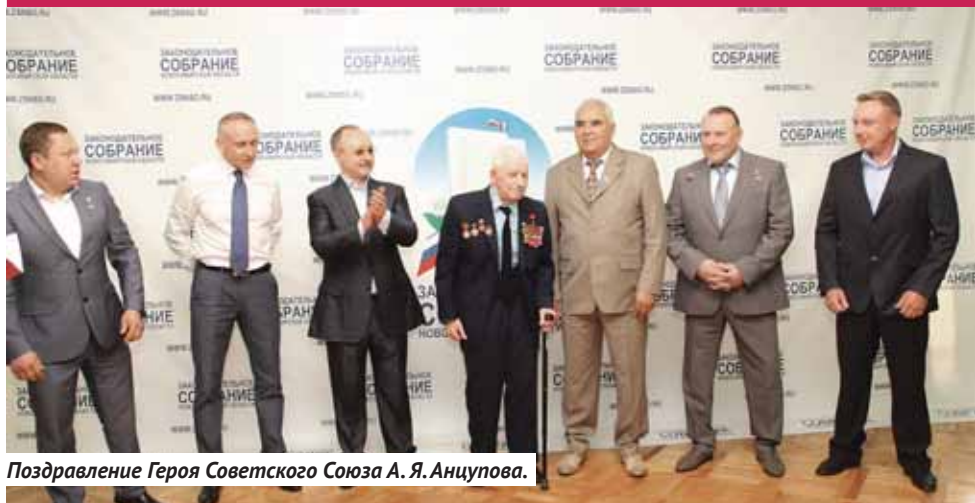
Поздравление Героя Советского Союза А. Я. Анцупова.