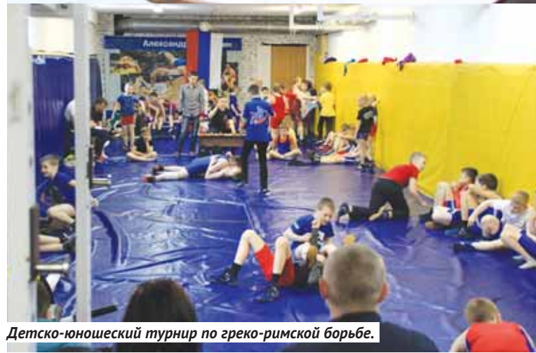
Детско-юношеский турнир по греко-римской борьбе.