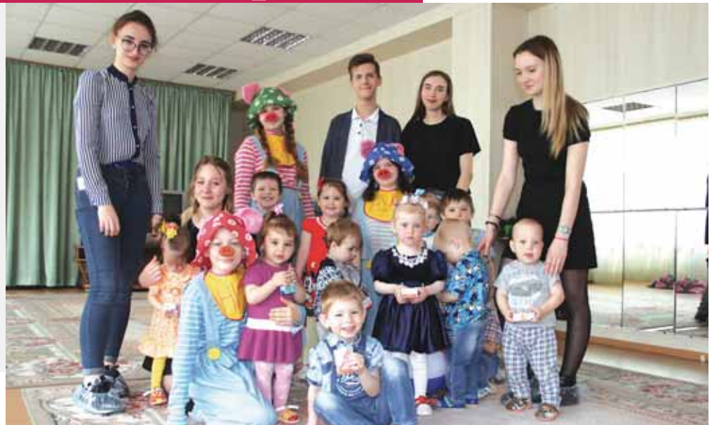
Члены Молодёжного совета в Доме малютки.

21 сентября Молодёжный совет и «Славянский фонд» в шести школах округа в честь Дня воинской славы России провели уроки