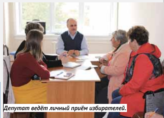
Депутат ведёт личный приём избирателей.

С января по октябрь 2018 г. на личном приёме депутата побывали 109 человек. В общественную приёмную обратились 301 человек. Бесплатную юридическую консультацию получили 172 избирателя.