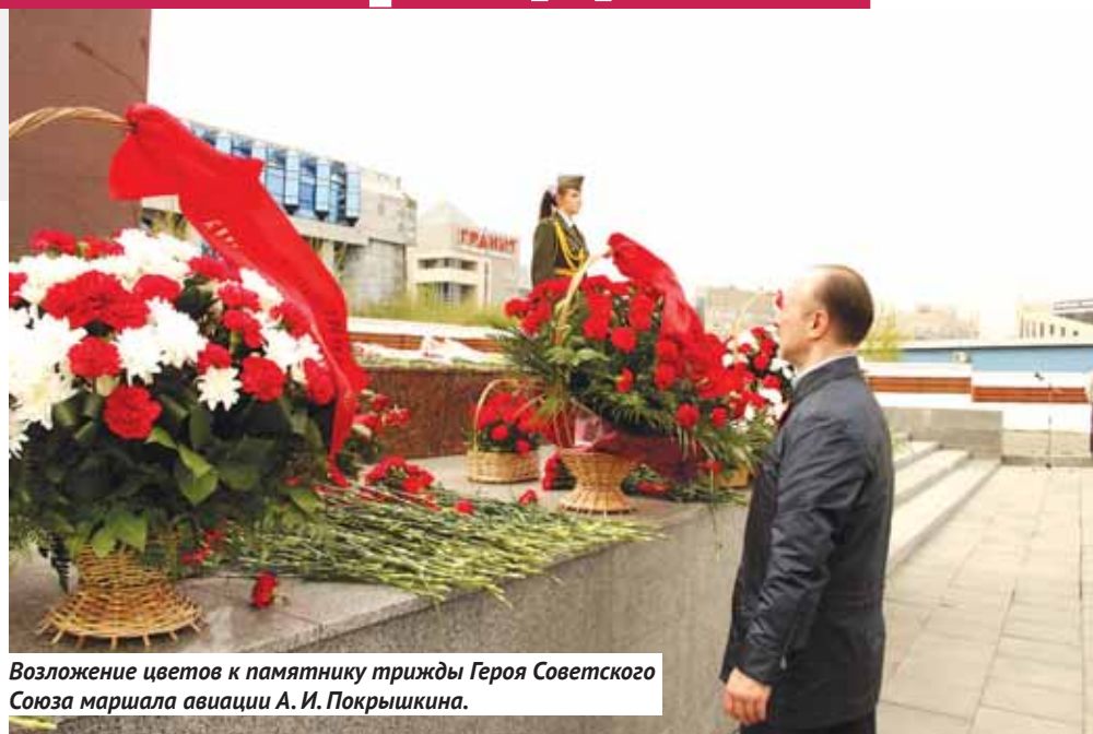
Возложение цветов к памятнику трижды Героя Советского Союза маршала авиации А. И. Покрышкина.

Мы сегодня переживаем один из самых сложных периодов истории, когда против России с целью не дать ей подняться с колен и вновь стать по-настоящему великой мировой державой, открыто выступают могущественные государства западного мира, не жалеющие для этого ни усилий, ни финансовых средств. Подкупленные либеральные СМИ, как за рубежом, так и внутри страны, изо всех сил поливают нашу Родину грязью, клеветнически обвиняя во всех мыслимых грехах, очерняя и искажают наше историче-