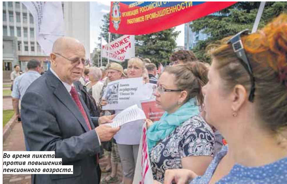
Во время пикета против повышения пенсионного возраста.