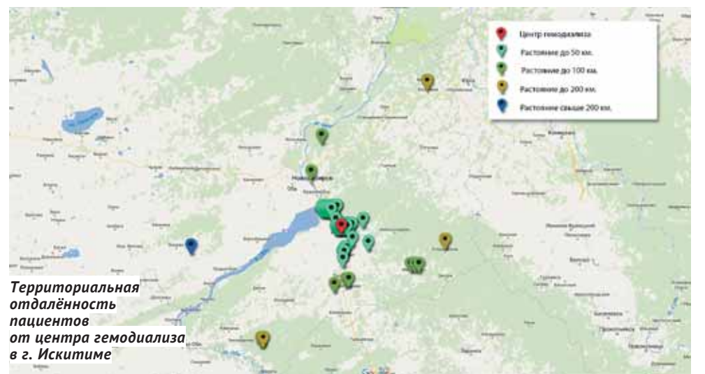
Территориальная отдалённость пациентов от центра гемодиализа в г. Искитиме