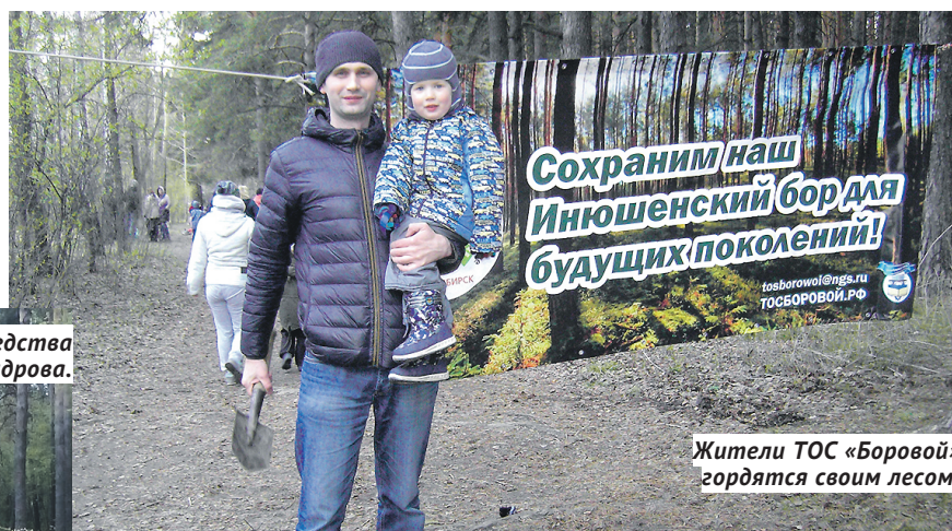
Жители ТОС «Боровой» гордятся своим лесом.