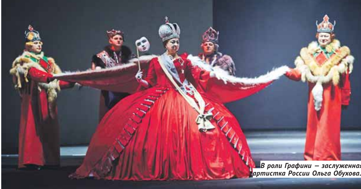
В роли Графини — заслуженная артистка России Ольга Обухова.