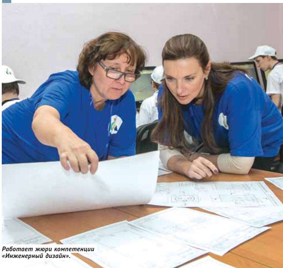
Работает жюри компетенции «Инженерный дизайн».