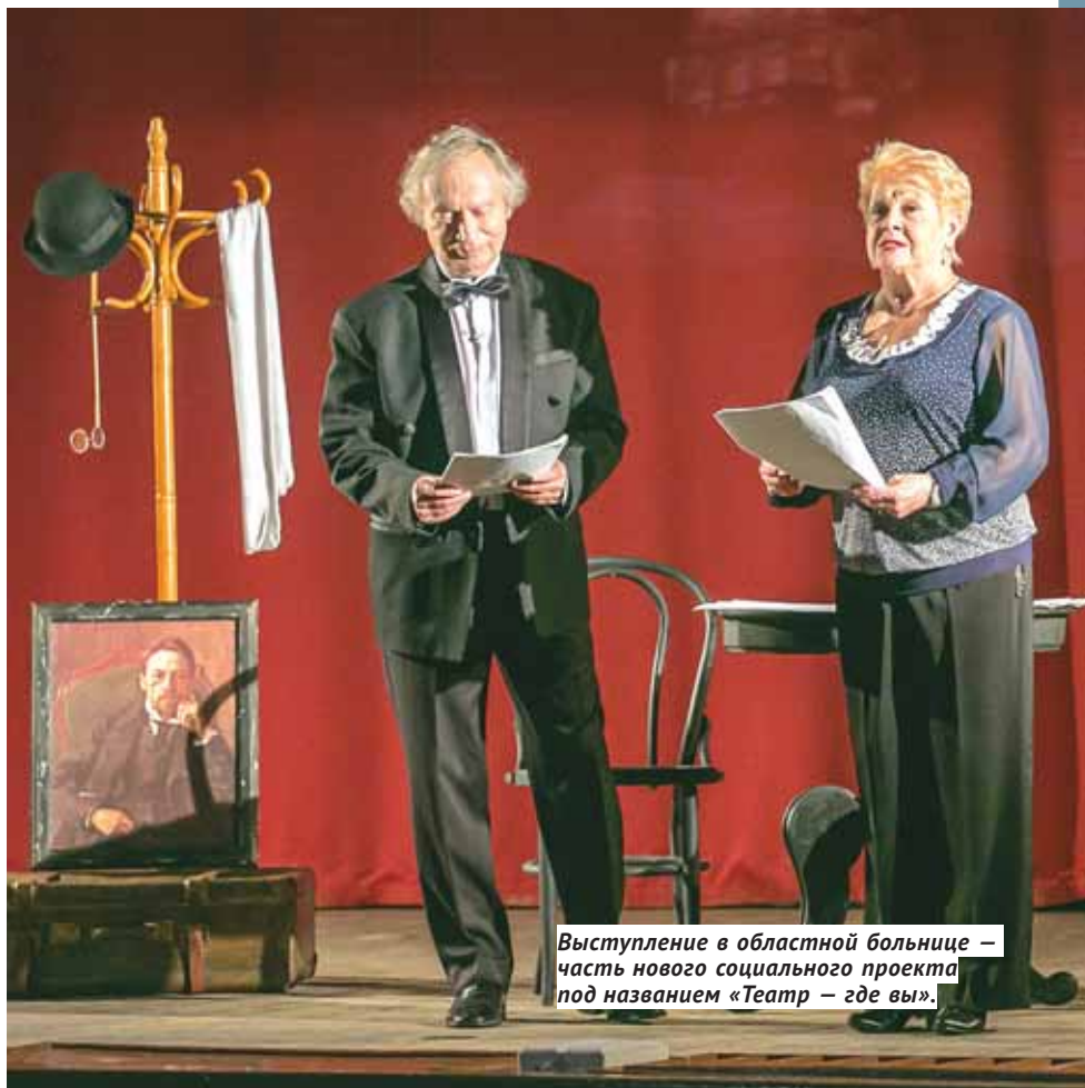
Выступление в областной больнице — часть нового социального проекта под названием «Театр — где вы».