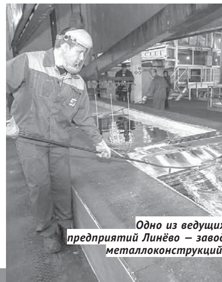
Одно из ведущих предприятий Линёво – завод металлоконструкций.