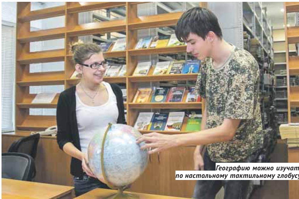
Географию можно изучать по настольному тактильному глобусу.

Появились в аудиториях специализированная мебель и оборудование. Внешне всё выглядит обычно, но отличия есть — в высоте, угле наклона столов, ширине проёма, специально подобранных для людей на колясках. Компьютеры и программное обеспечение позволяют обучаться как здоровым детям, так и студентам с нарушениями здоровья. Например, слабослышащие используют специальные наушники. Для слабовидящих подготовлены специальные клавиатуры. В библиотеку колледжа начали поступать книги со шрифтом Брайля. А географию можно изучать по настольному тактильному глобусу, имеющему цветную выпуклую поверхность. На повестке дня — обустройство доступной среды в общежитии колледжа, зала адаптивной физической культуры.