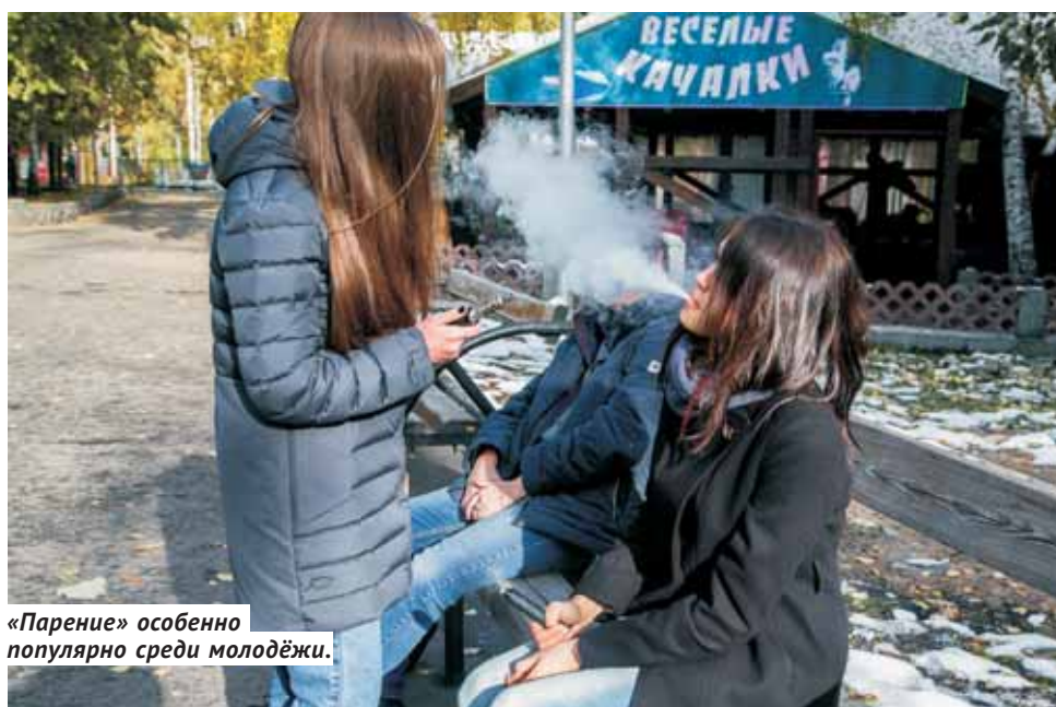
«Парение» особенно популярно среди молодёжи.