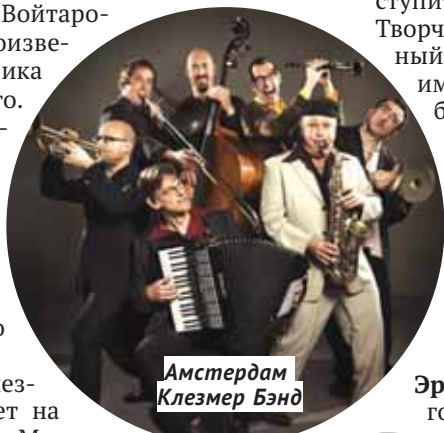
Амстердам Клезмер Бэнд

Завершится программа фестиваля джем-сейшном — выступлением свободного формата, где гости фестиваля и новосибирские джазовые музыканты импровизируют, стихийно объединяясь в ансамбли.