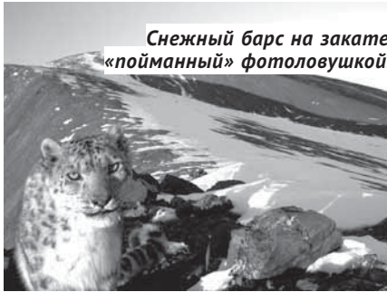
Снежный барс на закате, «пойманный» фотоловушкой.

ска, Екатеринбург, Сургута. А благодаря участнице из Бельгии майская экспедиция этого года получила статус международной.