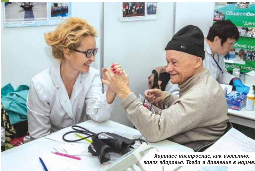
Хорошее настроение, как известно, — залог здоровья. Тогда и давление в норме.

В Новосибирске прошёл форум «Продлить жизнь», где можно было не только проверить своё здоровье, но и узнать о пользе массажа бамбуковыми розгами или блюд из пророщенных семян.