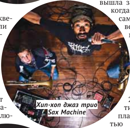
Хип-хоп джаз трио Sax Machine