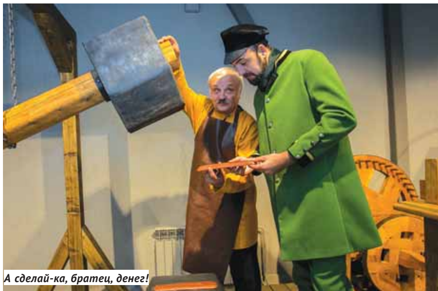
А сделай-ка, братец, денег!

О важности происходящего на торжественном открытии было сказано немало, но это тот самый случай, когда лучше один раз