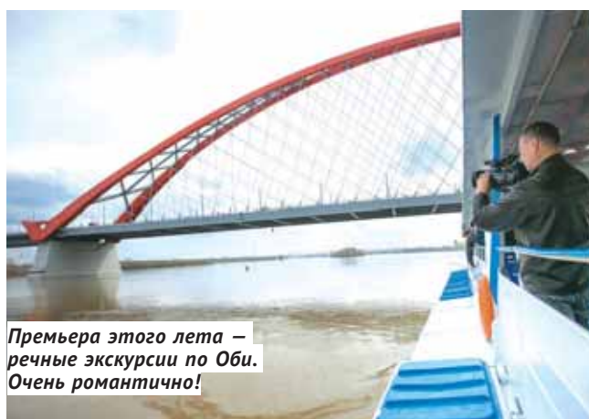
Премьера этого лета — речные экскурсии по Оби. Очень романтично!