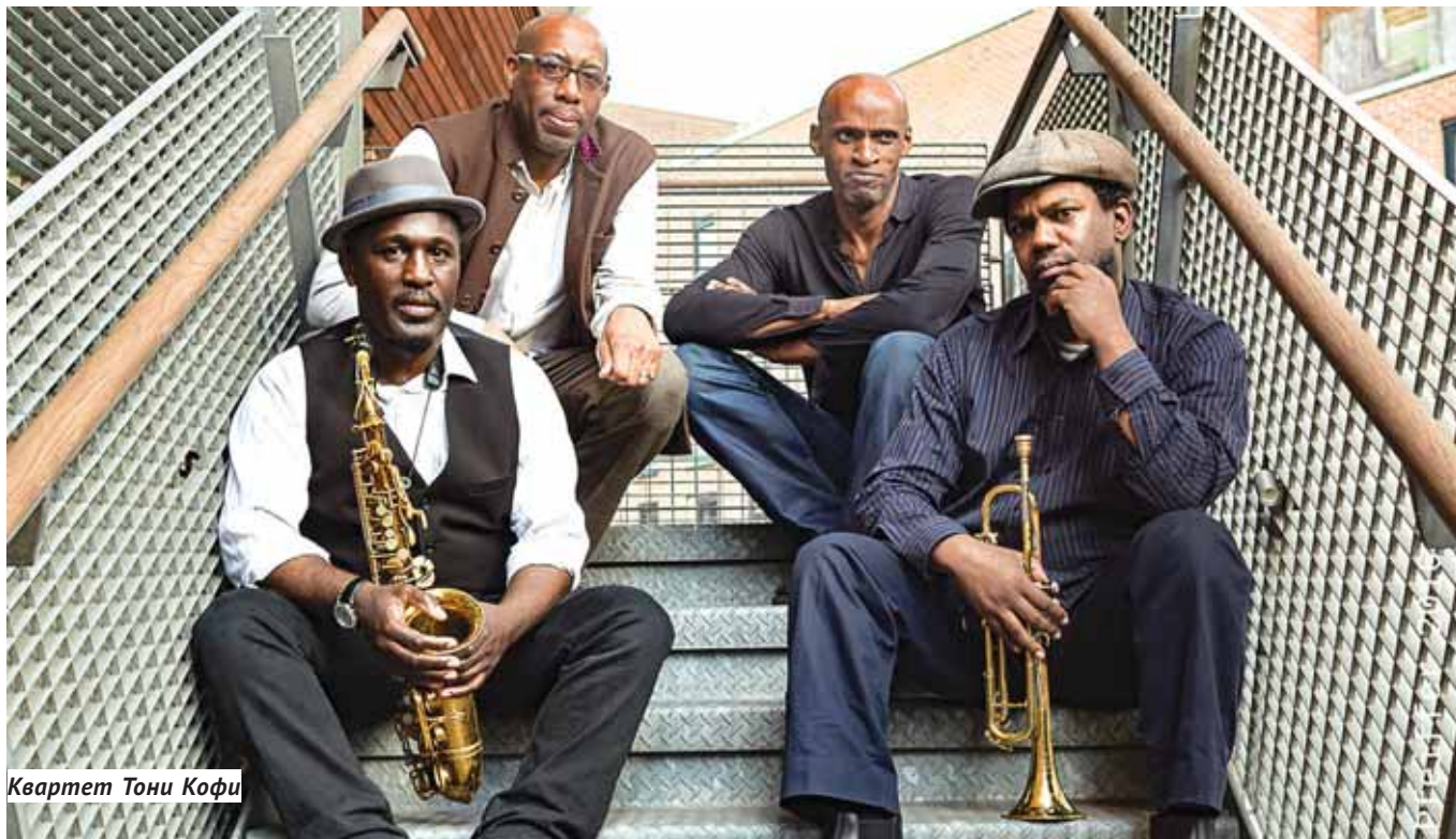
Квартет Тони Кофи

20 октября в Новосибирске откроется Международный фестиваль Sib Jazz Fest. Проект, организованный Новосибирской филармонией, в шестой раз соберёт на одной сцене ярчайших представителей джазового искусства со всего мира.