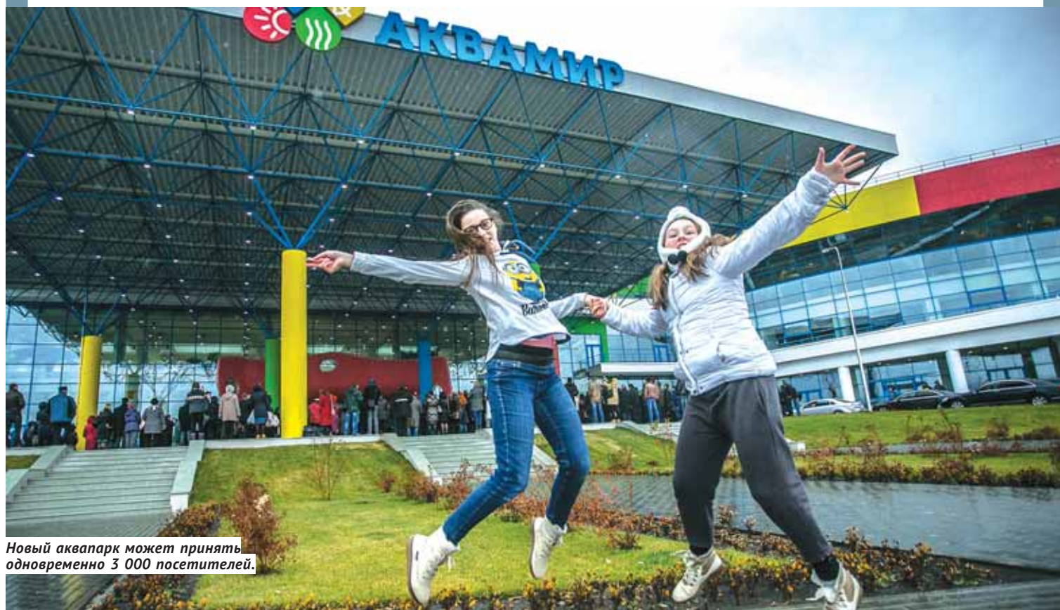
Новый аквапарк может принять одновременно 3 000 посетителей.

В Новосибирске с третьей попытки, наконец, открылся крупнейший крытый аквапарк России. Если отбросить ёрничающие по этому поводу, то понимаешь — всё к лучшему. Во-первых, инвесторы решили не подгоняться под определённые даты, сделав упор на максимальную надёжность и безопасность. А во-вторых, лучшего времени для открытия просто не придумать: когда на улице промозгло и некомфортно, так и тянет окунуться в лето.