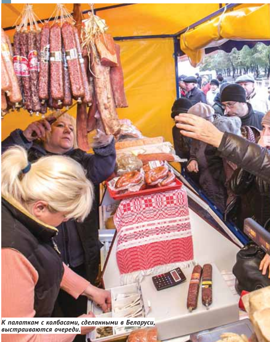
К палаткам с колбасами, сделанными в Беларуси, выстраиваются очереди.

Б олее 4 000 километров преодолели десятки большегрузных фур, чтобы разбить уже традиционный торговый городок в центре Новосибирска. Вопрос «зачем так далеко?» для самих белорусов не стоит — они всерьёз рассматривают наш регион как перспективнейший рынок сбыта своих товаров. Если когда-то в Новосибирске появятся постоянно действующие торговые точки производителей из братской республики, то очень многим местным они всерьёз осложнят жизнь.