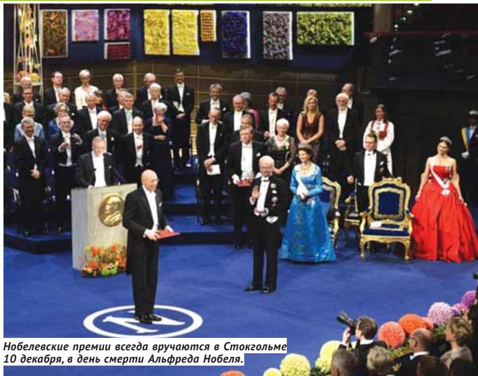
Нобелевские премии всегда вручаются в Стокгольме 10 декабря, в день смерти Альфреда Нобеля.