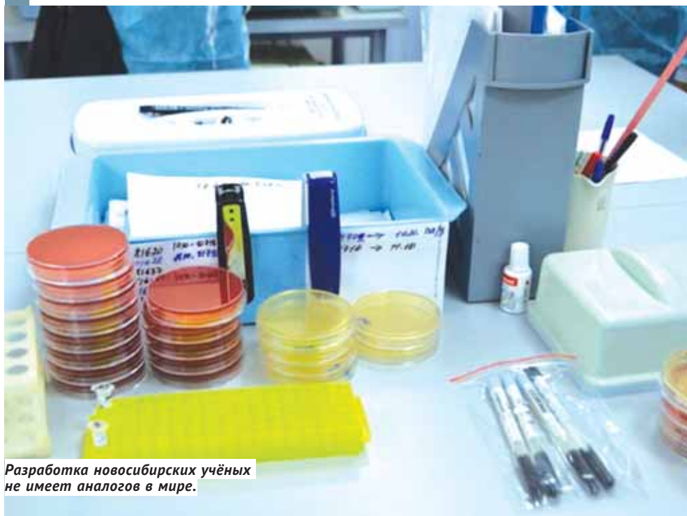
Разработка новосибирских учёных не имеет аналогов в мире.

С овместные разработки учёных Сибирского отделения РАН, Новосибирского НИИ туберкулёза и производителей лекарств позволяют повысить эффективность борьбы с одним из наиболее опасных инфекционных заболеваний. Отличительной особенностью новых препаратов против туберкулёза является способ их доставки к очагу инфекции — не в виде таблеток или инъекций, а в форме вдыхаемого пациентом наноаэрозоля. По словам министра здравоохранения Новосибирской области Олега Иванинского , данная разработка, не имеющая пока аналогов в мире, позволит вывести на новый уровень качество лечения инфекционных заболеваний. Наноаэрозольная форма доставки лекарства позволяет контролировать приём лекарства и исключает риск передозировки. В ближайшее время в Новосибирском НИИ туберкулёза начнутся доклинические и клинические испытания новых форм лекарств.