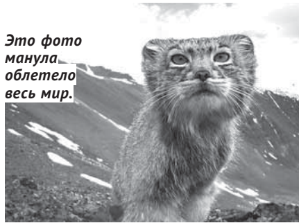
Это фото манула облетело весь мир.