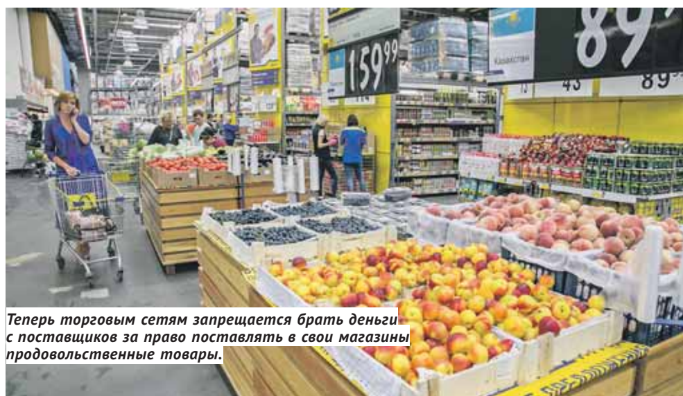
Теперь торговым сетям запрещается брать деньги с поставщиков за право поставлять в свои магазины продовольственные товары.