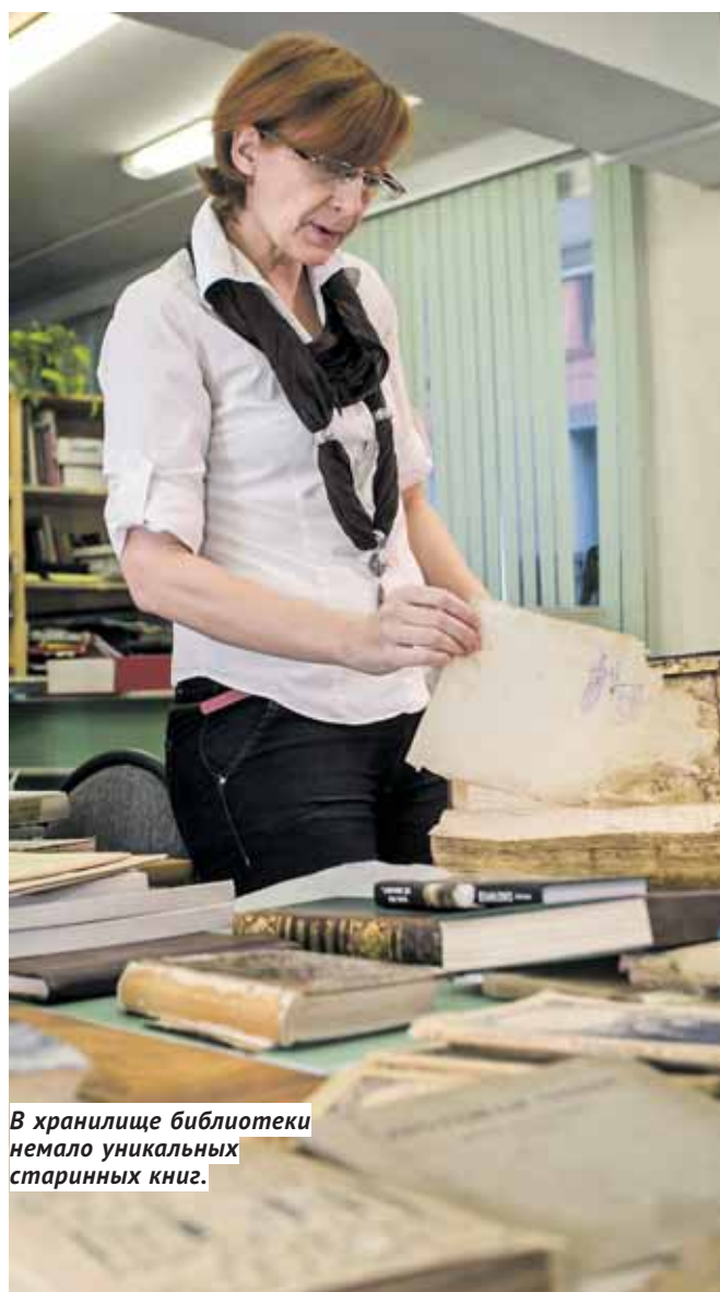
В хранилище библиотеки немало уникальных старинных книг.

КУЛЬТУРА Святая святых — так в областной научной библиотеке называют отдел редких и ценных книг. Основу фонда отдела, закрытого для посетителей, составляют книги XVI–XIX веков из коллекции Кольвано-Воскресенских горных заводов.