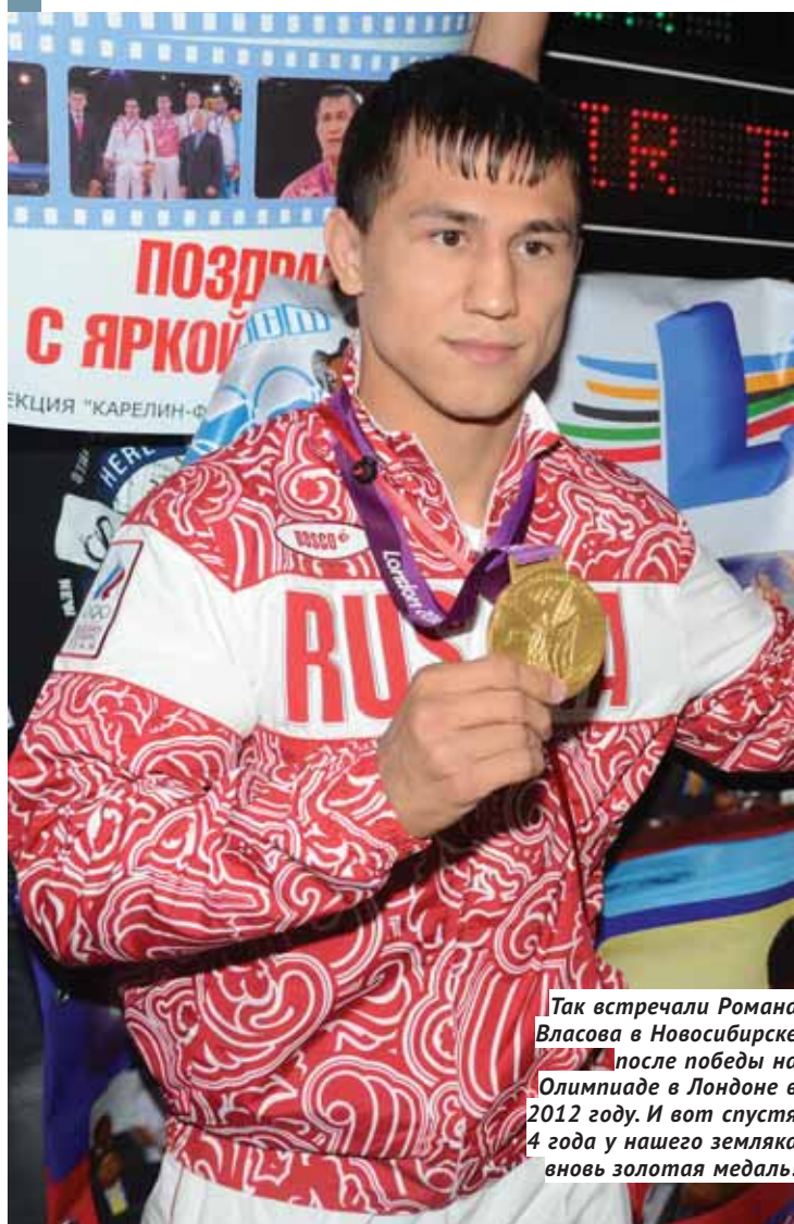
Так встречали Романа Власова в Новосибирске после победы на Олимпиаде в Лондоне в 2012 году. И вот спустя 4 года у нашего земляка вновь золотая медаль!

До 14 августа в активе новосибирской саблистки Юлии Гавриловой было по четыре победы на чемпионатах мира и Европы в командных турнирах, что недвусмысленно указывало, какая именно команда сегодня сильнейшая в мире. «Золото» и «серебро» Яны Егорян и Софьи Великой в личном турнире только укрепили уверенность, что командная победа достанется именно россиянкам. Оставалась интрига — выйдут ли на дорожку Юлия? Тем более что накануне мужчины-рапиристы обошлись силами трёх спортсменов, а французы, решившие уже в почти выигранном финале «заиграть» четвертого участника команды, жестоко за это заплатились.