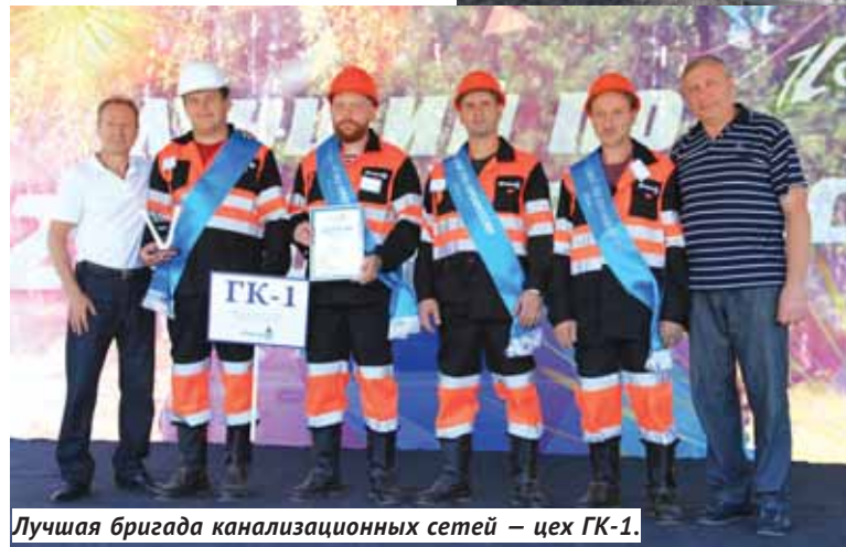
Лучшая бригада канализационных сетей — цех ГК-1.

— Ключевое слово, характеризующее ваше предприятие, — надёжность, — сказал глава области, — за что я и хочу вас поблагодарить от лица всех жителей города и области. «Горводоканал» — это не только Новосибирск, но и пригороды, входящие в агломерацию, специалисты МУПа здорово помогли нам при строительстве очистных сооружений в Куйбышеве.