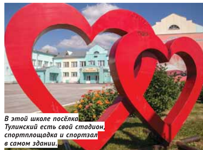
В этой школе посёлка Тулинский есть свой стадион, спортплощадка и спортзал в самом здании.

В библиотеке идёт процесс раскладывания учебников. Только в этом году учреждение приобрело более 2 тыс. экземпляров. Все школьники на 100 процентов будут обеспечены учебной литературой. Она выдаётся