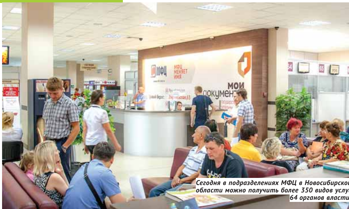
Сегодня в подразделениях МФЦ в Новосибирской области можно получить более 350 видов услуг 64 органов власти.

За повышение доступности и качества государственных и муниципальных услуг с помощью создания единого информационного пространства «отвечает» подпроект «Электронные сервисы для граждан». Он призван обеспечить создание единой технологии для сервисов органов власти, предоставления государственных и муниципальных услуг в электронном