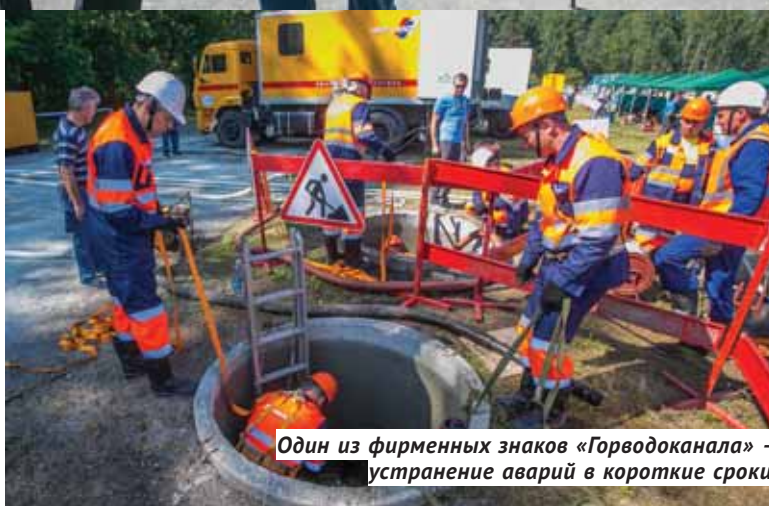
Один из фирменных знаков «Горводоканала» — устранение аварий в короткие сроки.

Приехавший поздравить «горводоканальцев» губернатор Новосибирской области Владимир Городецкий подчеркнул, что любая традиция хороша только тогда, когда востребована людьми. Сам глава области, кстати, ни разу не пропускал конкурс профессионального мастерства «Горводоканала», и собственными глазами видел всю эволюцию конкурса: