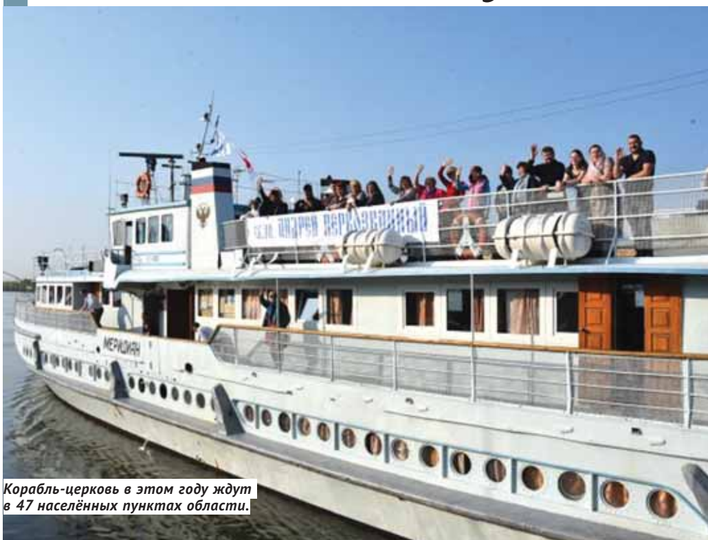
Корабль-церковь в этом году ждут в 47 населённых пунктах области.