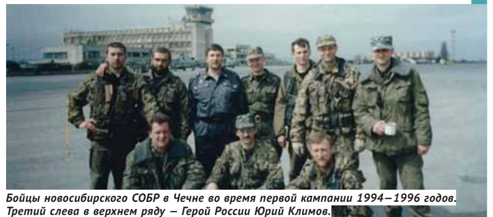
Бойцы новосибирского СОБР в Чечне во время первой кампании 1994–1996 годов. Третий слева в верхнем ряду — Герой России Юрий Климов.

вливаются в состав Национальной гвардии.