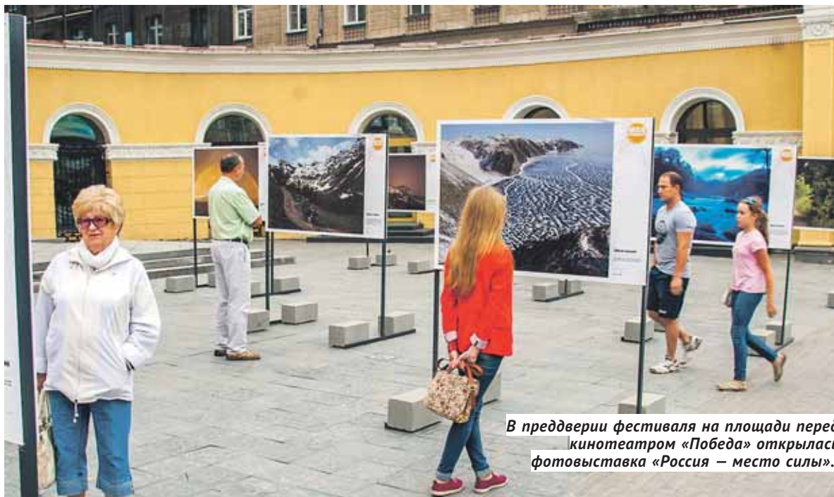
В преддверии фестиваля на площади перед кинотеатром «Победа» открылась фотовыставка «Россия — место силы».

Сегодня, 4 августа, в кинотеатре «Победа» открывается фестиваль фильмов о путешествиях «Моя Планета. Планета людей».