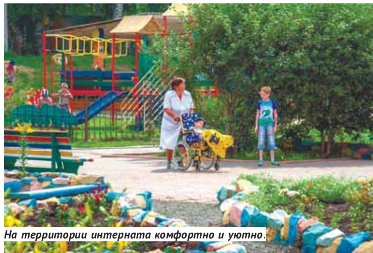
На территории интерната комфортно и уютно.

Мамочка очень довольна результатами реабилитации, единственное сожаление — поздно узнала о центре. Как узнала? Сарафанное радио.