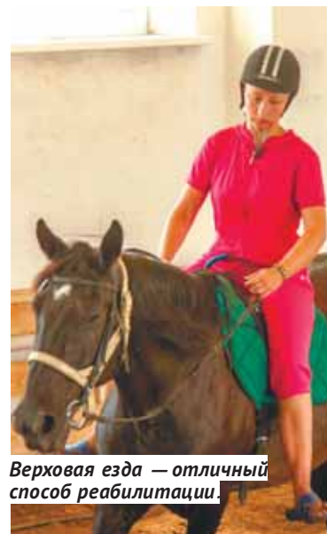
Верховая езда — отличный способ реабилитации.