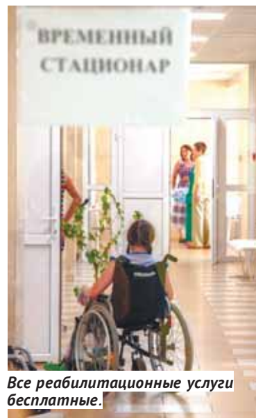
Все реабилитационные услуги бесплатные.