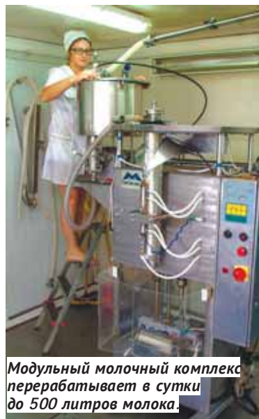
Модульный молочный комплекс перерабатывает в сутки до 500 литров молока.