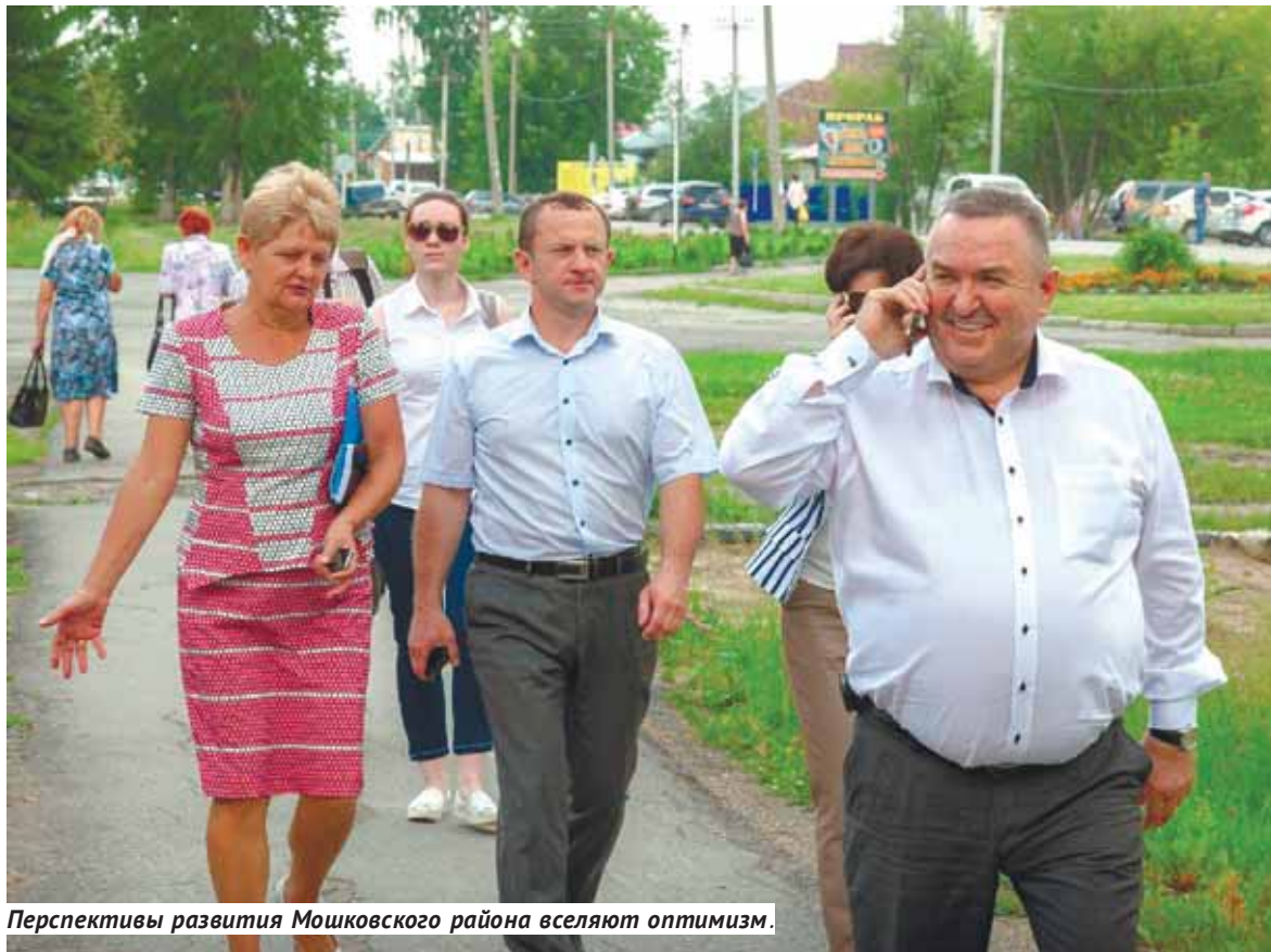
Перспективы развития Мошковского района вселяют оптимизм.

П осле того как Колыванский краеведческий музей переехал в отреставрированный и более просторный особняк купца Жернакова, старое здание музея пустым не осталось. Здесь был создан Дом ремёсел «Слобода», призванный возрождать традиции знаменитых колыванских мастеров. В это трудно поверить, но 100 лет назад в Колывани работало 126 небольших фабрик и заводов: слесарных, кирпичных, гончарных, кожевенных, шорных и других. По сути, здесь жили и работали мастера на все руки,