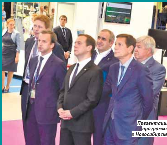
Презентация программы в Новосибирске.

Президенту РФ Владимиру Путину предложено несколько кандидатур на пост полномочного по правам ребёнка. Свои предложения по этому вопросу главе государства направили Совет по правам человека в России, Совет Федерации и партия «Яблоко». Все основные претенденты — женщины, хорошо известные и занимающиеся реализацией важных социальных проектов.