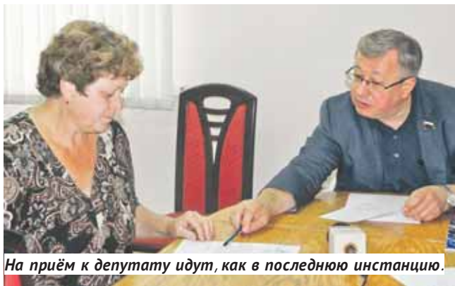
На приём к депутату идут, как в последнюю инстанцию.