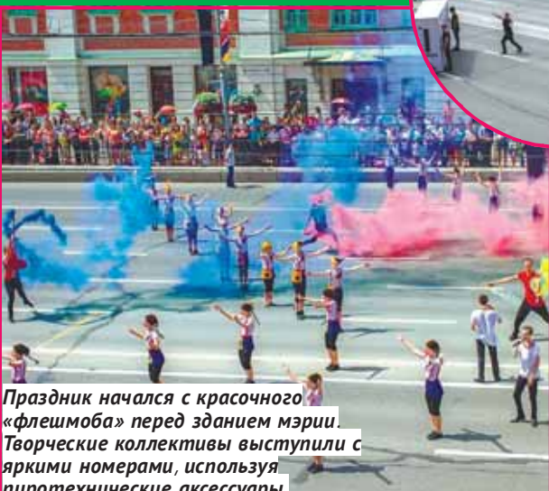
Праздник начался с красочного «флешмоба» перед зданием мэрии. Творческие коллективы выступили с яркими номерами, используя пиротехнические аксессуары.