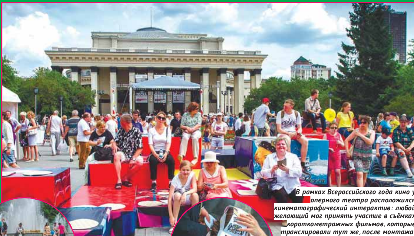
В рамках Всероссийского года кино у оперного театра расположился кинематографический интерактив: любой желающий мог принять участие в съёмках короткометражных фильмов, которые транслировали тут же, после монтажа.