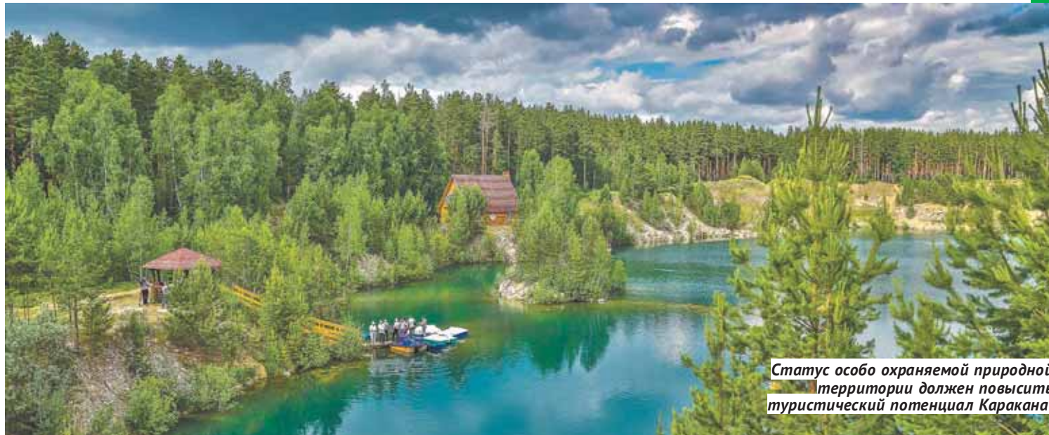
Статус особо охраняемой природной территории должен повысить туристический потенциал Каракана.

Сосновый ленточный бор площадью почти 100 тысяч гектаров, находящийся большей частью на территории Ордынского района, всегда имел большое водоохранное, рекреационное, научно-просветительное и хозяйственное значение. Помимо богатой природы, на территории бора сохранились памятники каменного века, относящиеся к третьему и четвёртому тысячелетиям до нашей эры. Здесь обнаружены предметы, относящиеся к ирменской и большебереченской культурам. Неудивительно, что величественному природному массиву, в переводе с тюркского зовущемуся «чёрный царь», давно хотели придать соизмеримый значению «титул». После того, как в 1995 году был принят федеральный закон об особо охраняемых природных территориях (ООПТ), Новосибирская область выступила с инициативой образования национального парка «Караканский бор». Впрочем, в Москве без энтузиазма отнеслись к пожеланиям сибиряков и предложили со второй по значимости ООПТ (после государственного природного заповедника) спуститься на строчку ниже — к теме природного парка. Впрочем, различия по статусу если и есть, то не такие существенные, чтобы заикливаться на этой теме. Суть