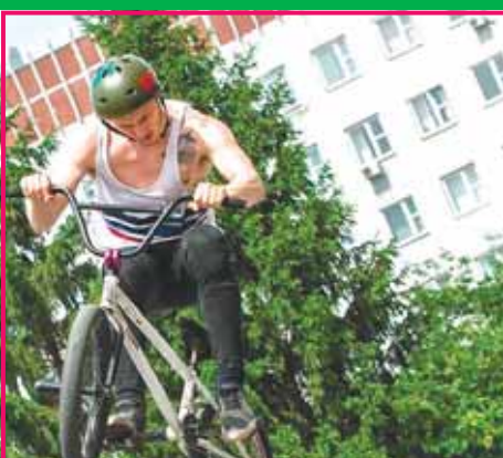
У театра «Глобус» расположилась площадка для любителей экстремальных видов спорта. Молодые люди виртуозно продемонстрировали трюки на скейте, велосипеде и роликах.