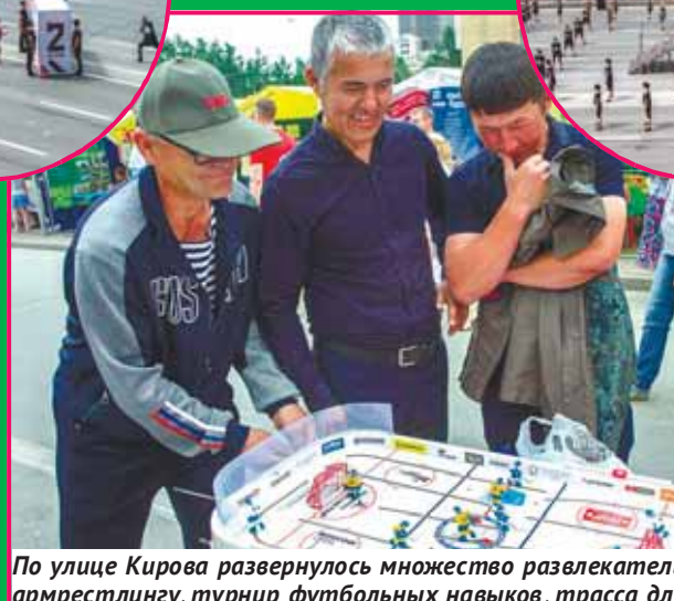
По улице Кирова развернулось множество развлекательных площадок: выставка автомобилей, соревнования по армрестлингу, турнир футбольных навыков, трасса для картинга, настольные игры и многое другое.