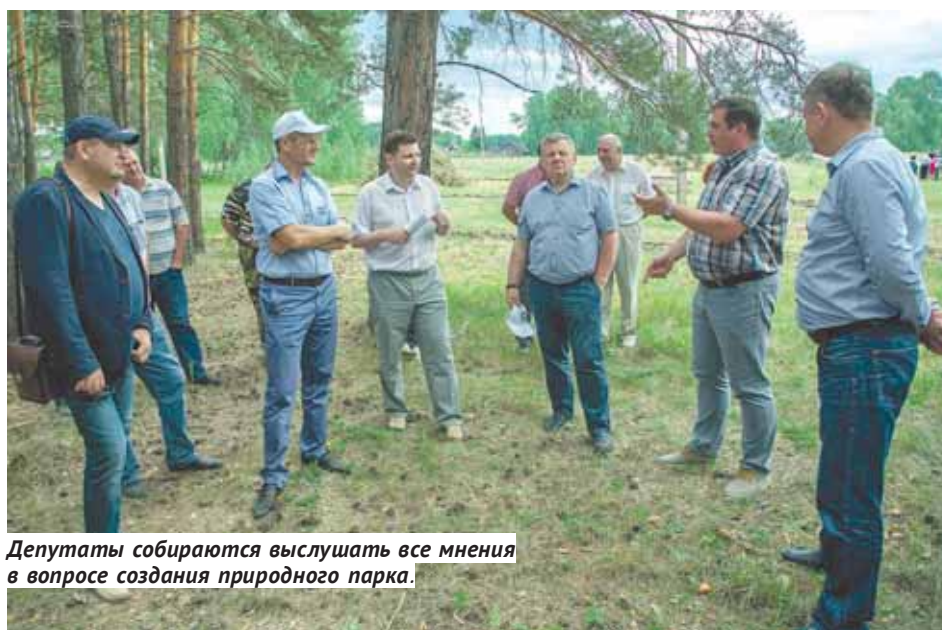
Депутаты собираются выслушать все мнения в вопросе создания природного парка.

Красноярском крае, например, на содержание ООПТ ежегодно из бюджета выделяется 60 миллионов рублей. Готовы мы к таким расходам?