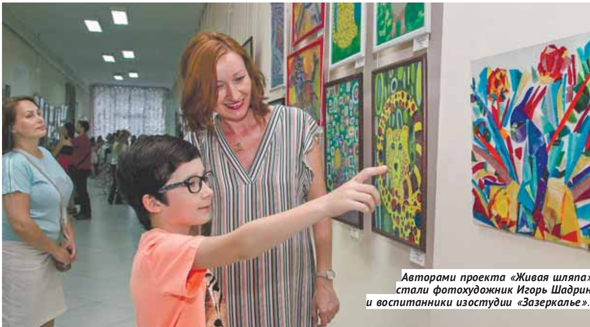
Авторами проекта «Живая шляпа» стали фотохудожник Игорь Шадрин и воспитанники изостудии «Зазеркалье».

Художественный музей представляет двойной проект «Живая шляпа».