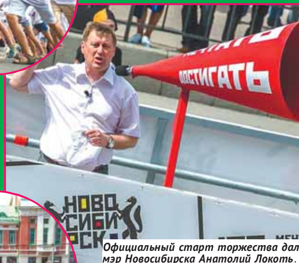
Официальный старт торжества дал мэр Новосибирска Анатолий Локоть.