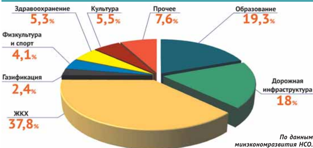
Отраслевая структура предложений по наказам, включённым в программу, в %

жения на более чем 1 300 объектах, наибольшую долю в них составляют те, что относятся к ЖКХ, дорожному хозяйству и образованию.