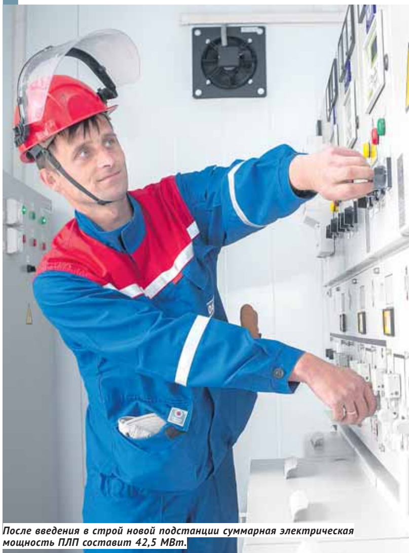
После введения в строй новой подстанции суммарная электрическая мощность ПЛП составит 42,5 МВт.

Компания «Региональные электрические сети» открыла под Новосибирском электроподстанцию, которая увеличит энергетические мощности Промышленно-логистического парка (ПЛП) на 40 %. Электроподстанция «Прокудская», построенная вблизи одноимённого села в Коченёвском районе, добавит ПЛП 16 МВт мощности, благодаря чему суммарная электрическая мощность, подведённая на площадку промпарка, достигнет 42,5 МВт.