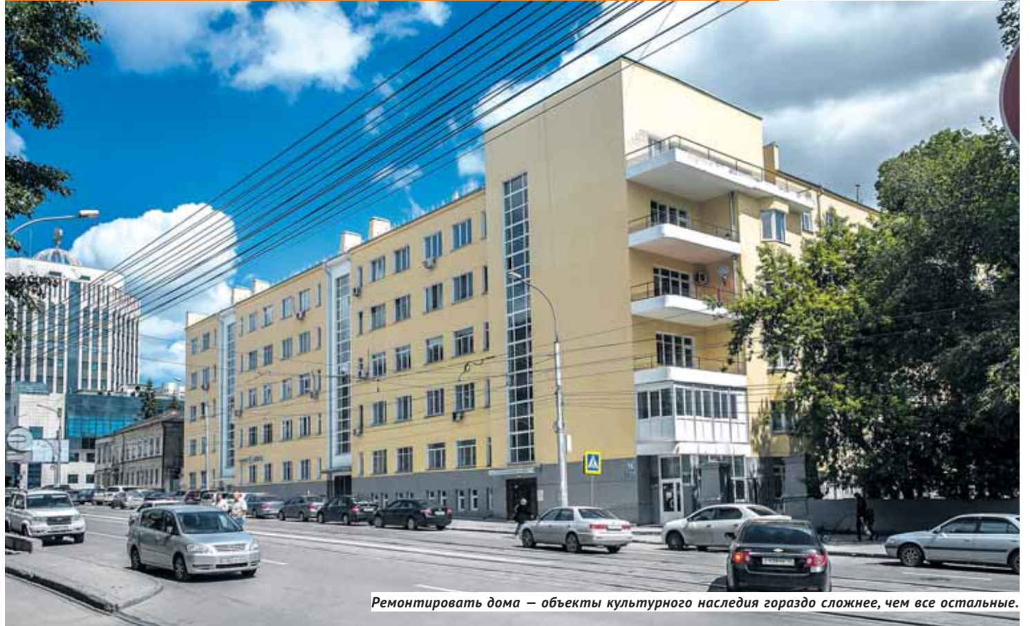
Ремонтировать дома — объекты культурного наследия гораздо сложнее, чем все остальные.

П роблемы, связанные с ремонтом домов в Новосибирске — хоть текущим, хоть капитальным, — вчера оказались в поле зрения Общественной палаты РФ. Первым летним днём высокие гости из Москвы, представляющие комиссию палаты по развитию социальной инфраструктуры, местного самоуправления и ЖКХ, провели в сибирской столице выездное совещание. В совещании приняли участие представители областного правительства, Государственной жилищной инспекции, управляющих компаний, силовых структур.