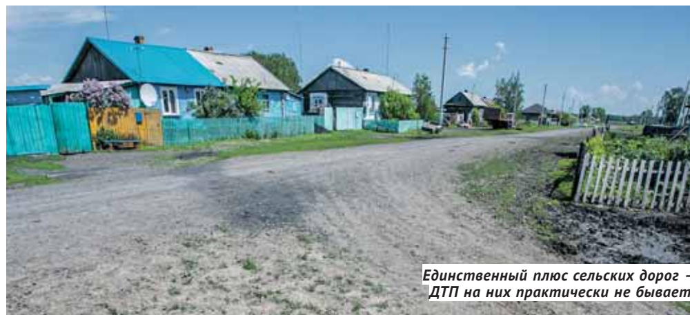
Единственный плюс сельских дорог — ДТП на них практически не бывает.

Казалось бы, главная проблема на поверхности: денег не хватает как на новое строительство, так и на содержание. В Новосибирской области, где протяжённость дорожной сети составляет более 25 тысяч км, 64 % дорог находятся не в нормативном состоянии. Региональные дорожные фонды, появившиеся в 2012 году, не растут, а на все местные дороги России, включая дороги с низкой интенсивностью — менее 400 машин в сутки — было выделено всего 62,5 миллиарда рублей.