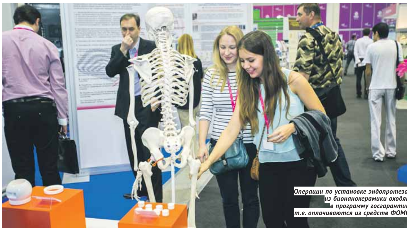
Операции по установке эндопротезов из бионанокерамики входят в программу госгарантий, т.е. оплачиваются из средств ФОМС.

ИННОВАЦИИ До 40 % потребности России в эндопротезах намерен обеспечить первый в стране Медицинский промышленный парк.