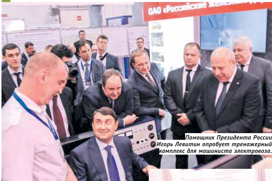
Помощник Президента России Игорь Левитин опробует тренажерный комплекс для машиниста электропоезда.

весного движения, новые транспортные услуги грузовладельцам, современный тренажерный комплекс для машиниста электропоезда и другие.