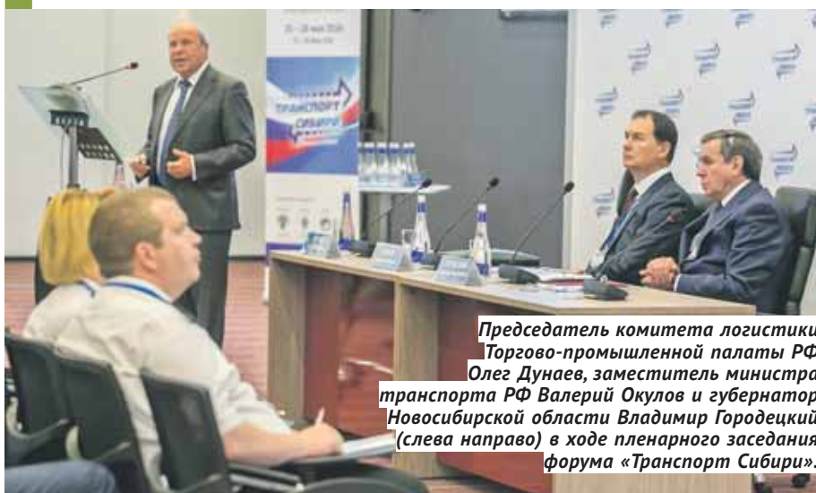
Председатель комитета логистики Торгово-промышленной палаты РФ Олег Дунаев, заместитель министра транспорта РФ Валерий Окулов и губернатор Новосибирской области Владимир Городецкий (слева направо) в ходе пленарного заседания форума «Транспорт Сибири».

Мы привыкли считать, что Новосибирск — крупнейший транспортно-логистический центр Сибири (что полная правда), являющийся центром экономического притяжения территории с радиусом 700 километров и населением в 13 миллионов человек. Наличие на территории нашей области 79 процентов складских комплексов категорий «А» и «В» всего Сибирского федерального округа автоматически делает регион крупной перевалочной базой и главным транзитным центром. Но экономика и логистика не стоят на месте, и жизнь постоянно бросает нам новые вызовы, на которые необходимо своевременно реагировать.