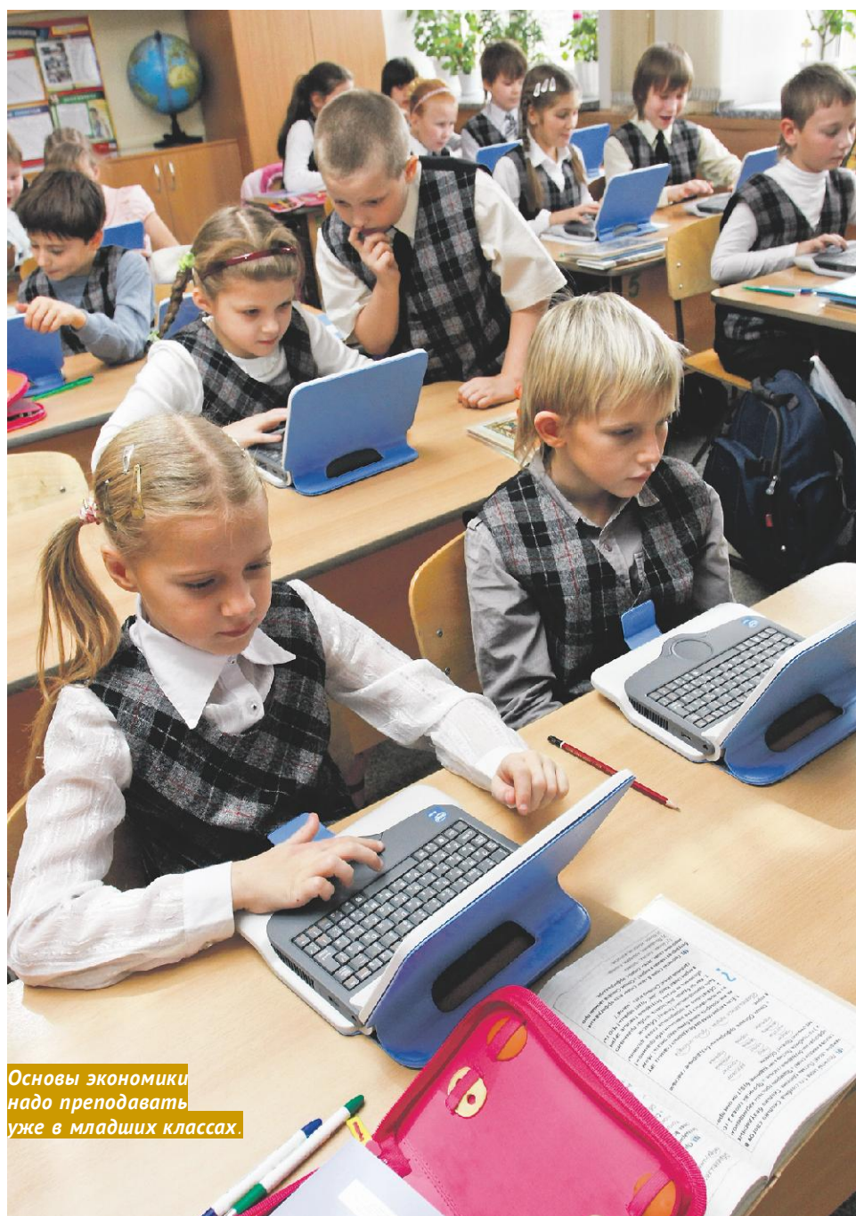
Основы экономики надо преподавать уже в младших классах.

Все самые лучшие надежды у нас принято связывать с подрастающим поколением. Ожидание, что нынешние дети будут