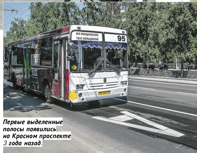
Первые выделенные полосы появились на Красном проспекте 3 года назад.

В Новосибирске уже есть положительный опыт создания выделенных полос на Красном проспекте. По дан-