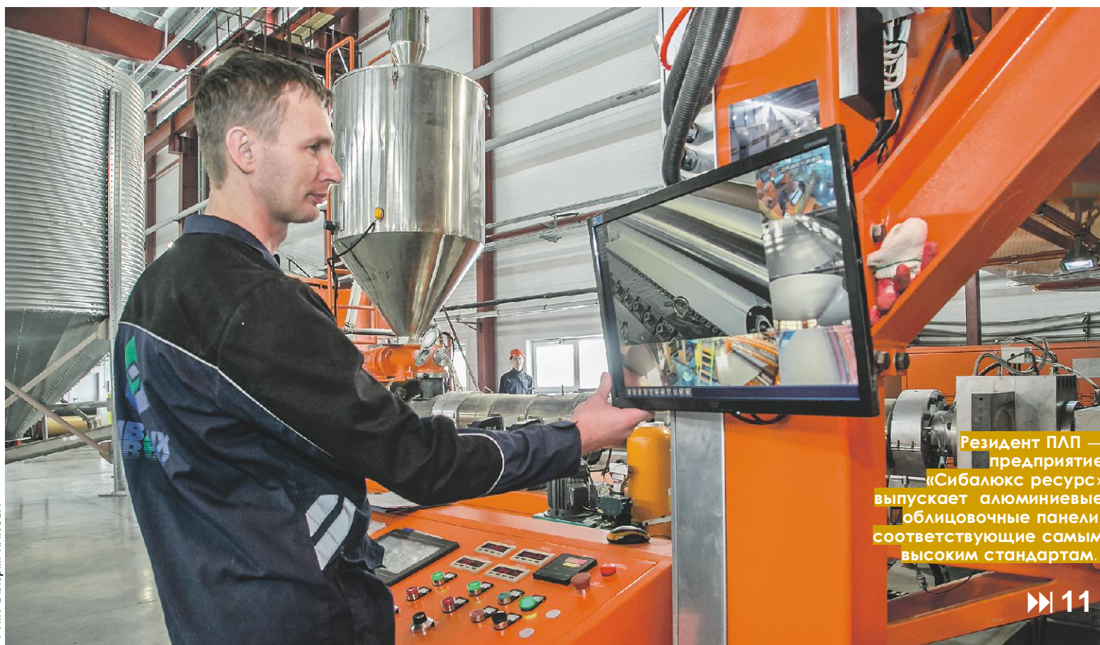
Резидент ПЛП — предприятие «Сибалюкс ресурс» выпускает алюминиевые облицовочные панели, соответствующие самым высоким стандартам.