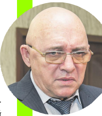
Сергей ПЫХТИН, министр социального развития НСО

Идеальная модель социальной помощи — точечное определение адресата, дифференцированный подход, как по объёму, так и по видам услуг, разработка и реализация специальных мер по превращению социального иждивенчества (в случае принадлежности получателя помощи к экономически активному населению), оценка эффективности предоставления помощи. Сегодня именно к этой модели стремятся социальные службы региона.