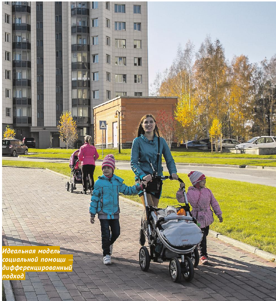
Идеальная модель социальной помощи — дифференцированный подход.

Ежемесячно в регионе назначается и предоставляется более 1 миллиона социальных выплат. На меры социальной поддержки ежегодно тратится почти 8% бюджета Новосибирской области. В 2015 году эта сумма составила 8,6 млрд рублей. Можно только приветствовать, что область не жалеет средств на поддержку ветеранов и многодетных семей, малообеспеченных граждан и людей, попавших в трудную жизненную ситуацию. Но насколько эффективно расходуются такие немалые средства?