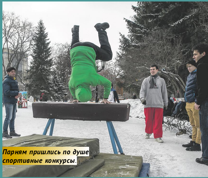
Парням пришлось по душе спортивные конкурсы.