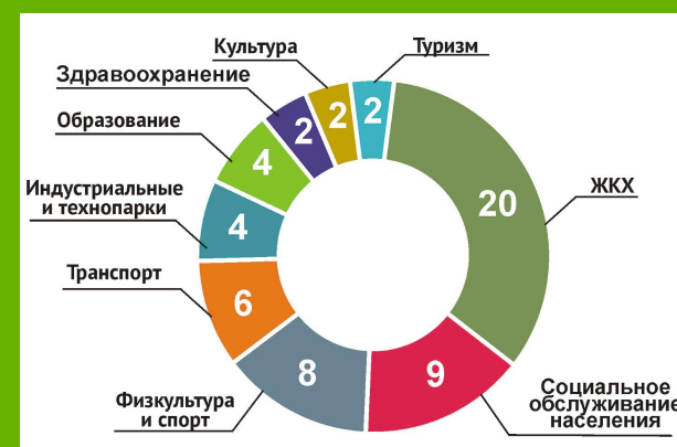
По данным минэкономразвития НСО