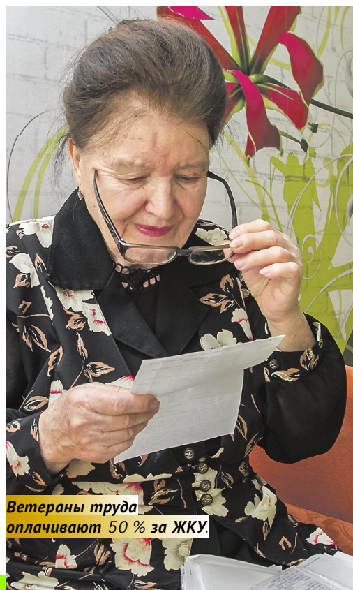
Ветераны труда оплачивают 50 % за ЖКУ.