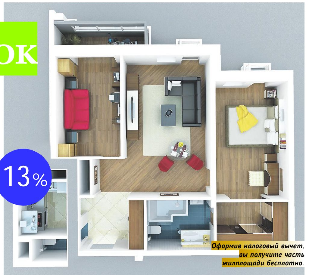
Оформив налоговый вычет, вы получите часть жилплощади бесплатно.

Когда год, в который была сделана покупка, закончится, направляйтесь в налоговую инспекцию по месту жительства (именно