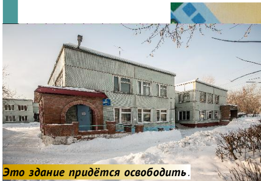
Это здание придётся освободить.

Минимум 1,5 миллиона рублей нужно собрать, чтобы помочь Новосибирскому центру адаптации детей-инвалидов (ЦАДИ) переехать в другое помещение.