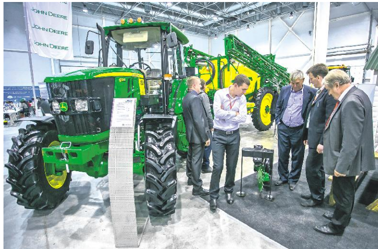
По традиции в рамках Дней урожая прошла выставка сельскохозяйственной техники.

Действительно, так и было: публикации за 2008—2010 годы (время «разгара» программы) можно легко найти в интернете. Все же думали, что сейчас мы купим пару мощных тракторов, сеятельных комплексов, несколько комбайнов — и полностью заменим весь старый парк техники. Будем быстро проводить посевные, не упускать хлеб под октябрьские