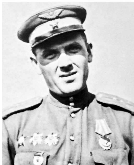
В первый послевоенный год.

— 5 июля нас подняли по тревоге — немцы перешли в наступление, — рассказывает ветеран. — Предстоял марш-бросок к станции Поньри. Она занимала очень важное стратегическое положение, прикрывая железную дорогу Орёл — Курск, и немцы хотели овладеть этим железнодорожным узлом во что бы то ни стало. Когда враг ворвался на станцию, наши стали отступать. Думали, что идём на подмогу, а оказались лоб в лоб с противником. Бои за станцию Поньри были самыми жестокими. Дома переходили из рук в руки. Мы то оборонялись, то шли в атаку. Лошадей поубивало, пушки «сорокопятки» практически на себе тащили. Да и личный состав сильно уменьшился. Из 104 бойцов у меня только 27 человек осталось вместе с ранеными. Я и сам был ранен. С этой горсткой мы 12 июля пошли в наступление. И тут слева я увидел, как пошли танки. Много танков с обеих сторон. Завязался танковый бой. Это было страшное зрелище. После тех боёв дивизию отправили на формирование, настолько она поредела.