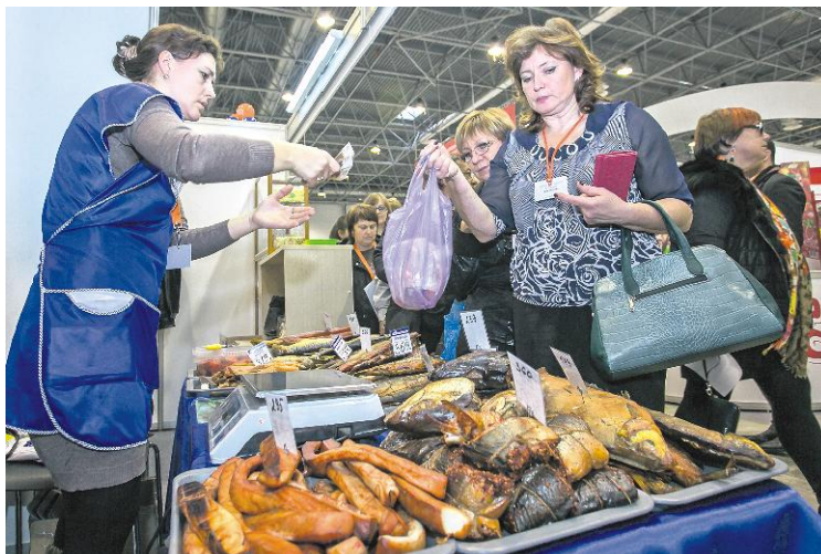
Сибирская рыба — один из самых востребованных товаров на продовольственных ярмарках.

Дискуссия в Новосибирске, однако, отличалась от формата томской встречи, прежде всего, по комбинации обсуждаемых вопросов и привлечённых экспертов. Специалисты как обсудили практики построения аквакультуры и аспекты индустриального рыбодоводства, так и уделили пристальное внимание другим слагаемым успеха: селекции и районированию,