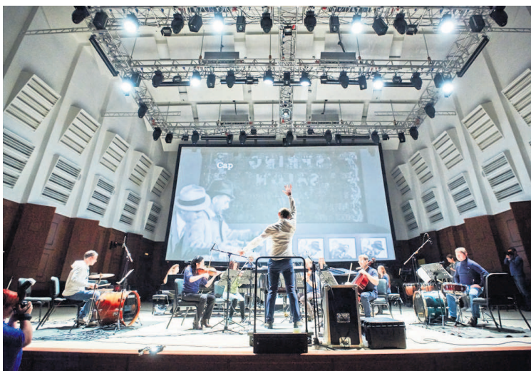
Репетиция видеооперы «Три истории» на сцене ГКЗ имени Каца.

— Это история о том, насколько человек прав, насколько далеко он идёт и не пытается