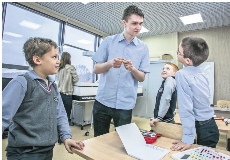
С детьми в основном занимаются студенты и аспиранты НГУ