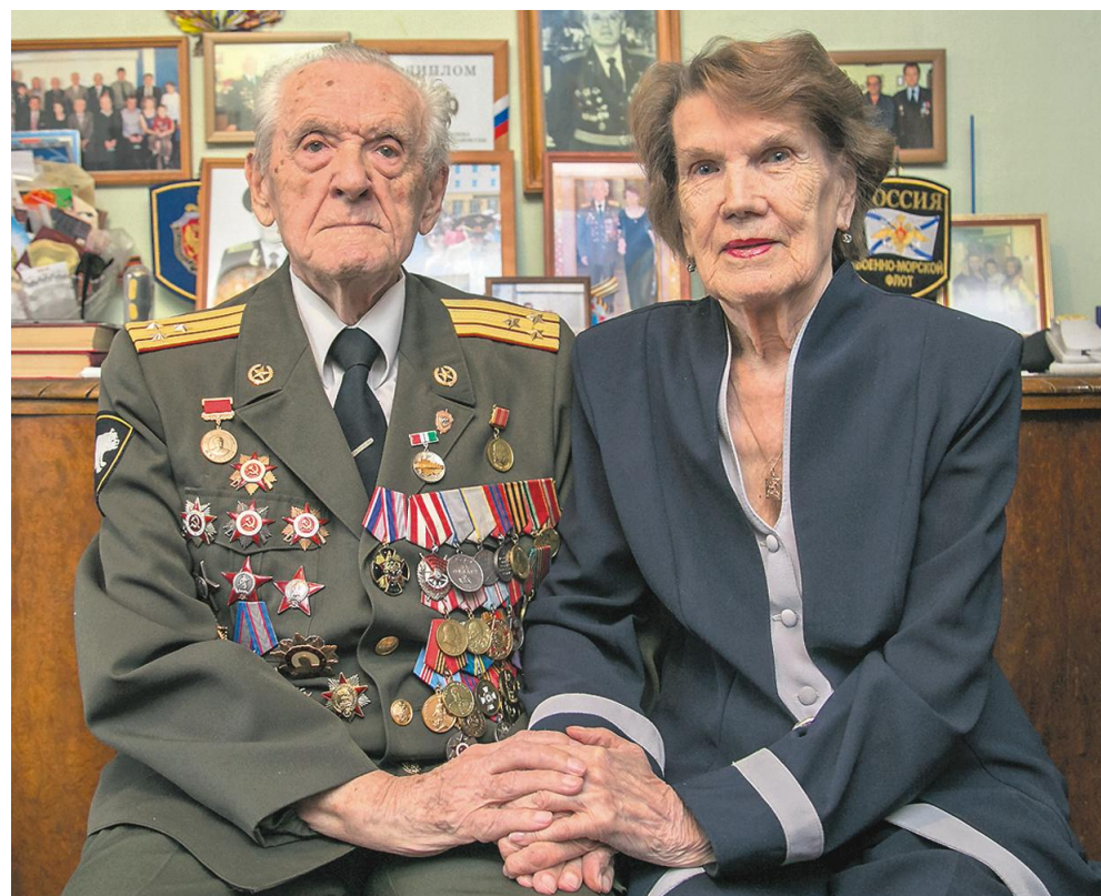
Счастливы вместе 73 года.