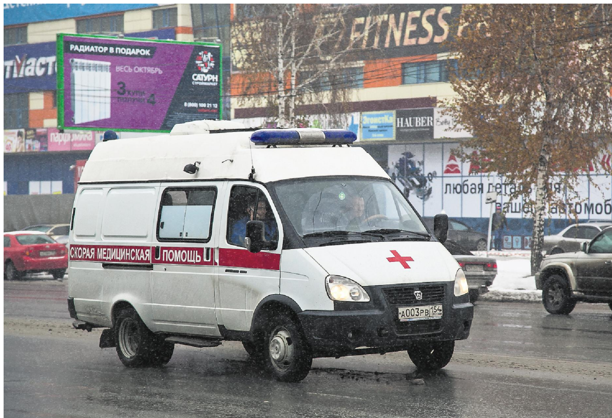
Скоро вызвать «скорую помощь» можно будет, позвонив по номеру 112.