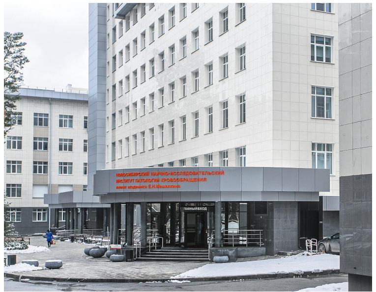
НИИ им. Мешалкина станет центром нового индустриального медицинского парка «Зелёная долина».

В этом году, наконец, заработала наша областная программа поддержки медицинской промышленности. На неё выделено 10 миллионов рублей. Основные направления, которые предполагается поддержать, — доклинические и клинические испытания медикаментов, научно-технические разработки и сертификация лабораторий, которые закрепляют результаты испытаний. Доклиника и клиника из-за нехватки средств часто затягиваются очень надолго, мы хотим помочь предприятиям