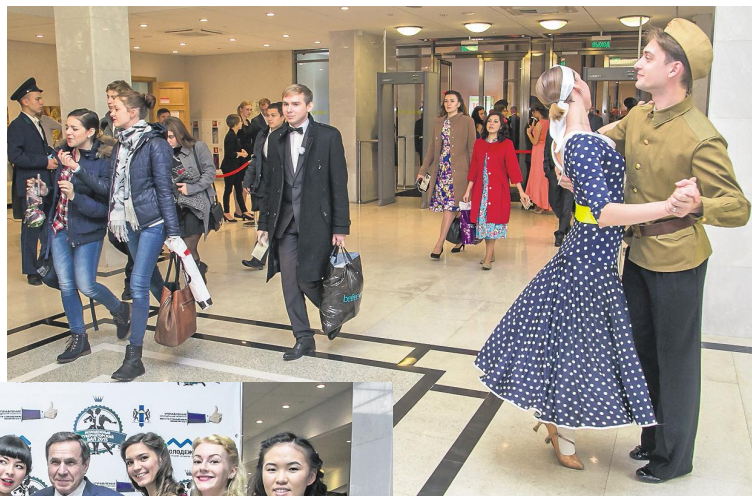
Участники и гости бала сразу при входе в концертный зал погружались в романтические послевоенные времена.