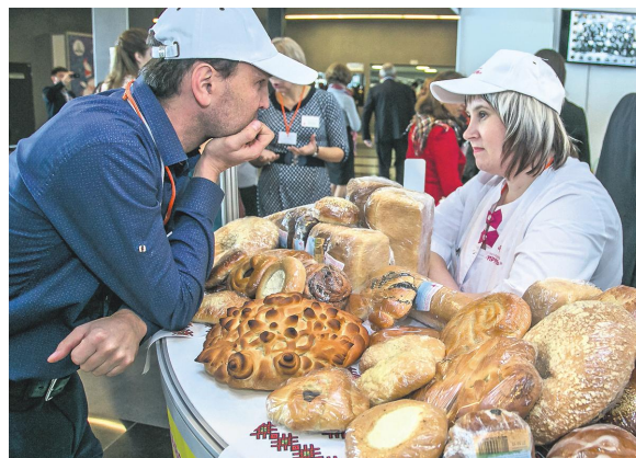
В этом году в НСО собрано более 2,4 млн тонн зерна. Значит, будем с хлебом.

Когда этот номер газеты уже будет в ваших руках, состоится самая приятная часть огромного мероприятия: чествование и награждение лучших районов, хозяйств и отдельных тружеников, достигших наивысших успехов на уборке зерновых культур. Нынешний год — если брать только результат — получился успешнее прошлого (собрали более 2,4 миллиона тонн зерна), и эти люди достойны своих наград, но, как совсем недавно отмечал губернатор Новосибирской области Владимир Городецкий, не хватает главного — стабильности: то супер-