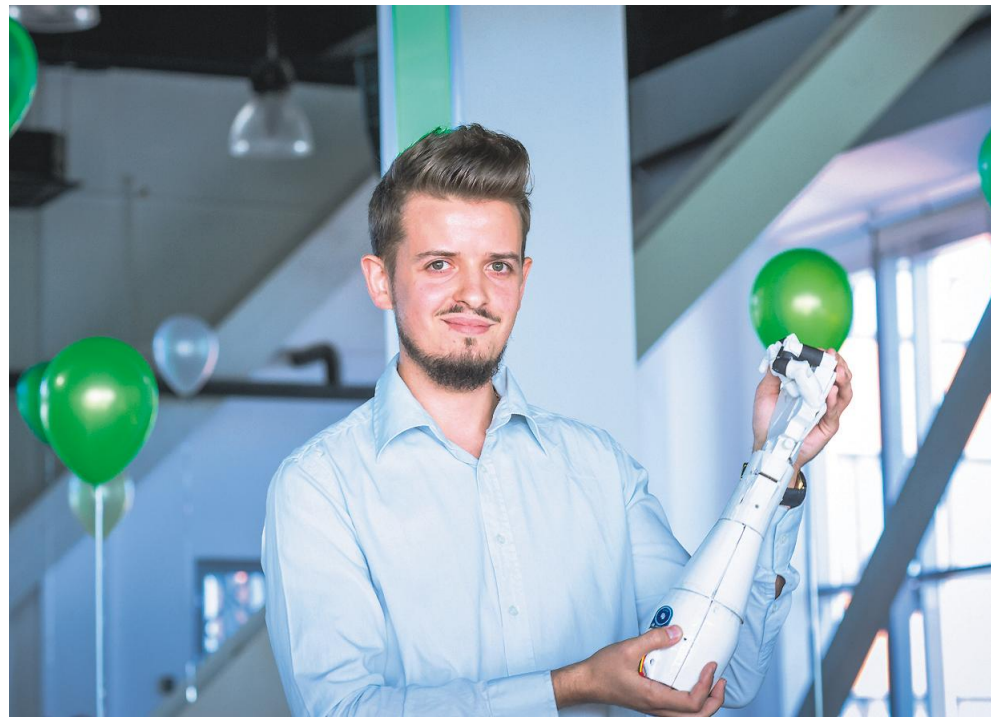
Роботизированный протез кисти от Robotez пока выглядит так.

Прошлый год для Новосибирска прошёл тихо. В этом году Новосибирскую область представляют пять компаний — резидентов Академпарка. Результаты их работы на форуме мы узнаем к воскресенью.