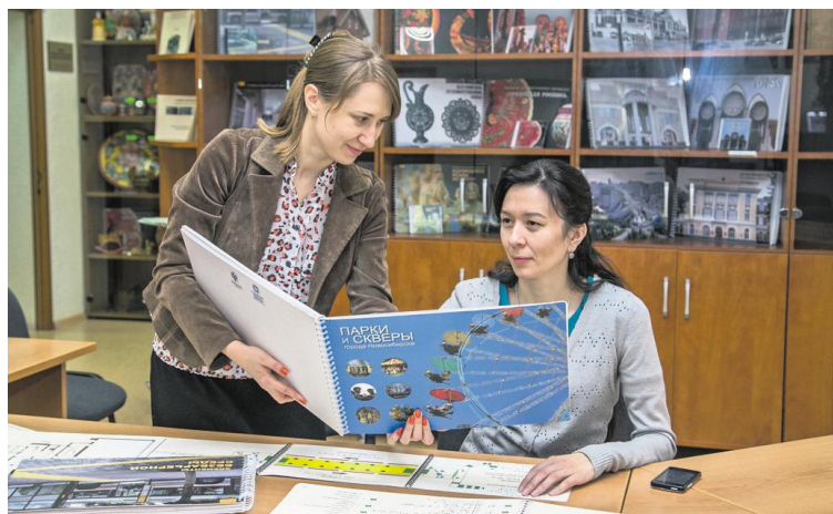
Одна из многоформатных пособий рассказывает о парках и скверах Новосибирска.

Общение с такими людьми очень высокой культуры, интеллекта, которые спокойно и достойно, результативно преодолевали барьеры, вставшие на их жизненном пути, научили многому. А главное — зародили идею о том, что нужно всеми возможными способами по-