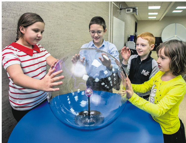
В детском технопарке Академпарка обучаются одарённые дети со всего Новосибирска

Одарённые дети отличаются от своих сверстников, поэтому к ним нужен нестандартный подход, отмечают в детском технопарке. Во время занятий здесь не работает принцип «я учитель, ты ученик», как это часто бывает в школе. Дети видят в учителях скорее партнёров, которые передают им свои знания. С детьми работают студенты и аспиранты НГУ, которых курируют опытные педагоги. Мы помогаем им при построении образовательного процесса, при выборе методического материала и составлении учебного плана. Очень важно, чтобы в процессе обучения вниманием были охвачены все ученики, только так возможно добиться желаемого результата. Поэтому группы небольшие — по 10—12 человек. Сложные дисциплины, как математика и программирование, ведутся сразу двумя преподавателями. Как правило, занятия построены не на лекционном подходе, а на практическом. Так, на уроках математики ребята в игровой форме