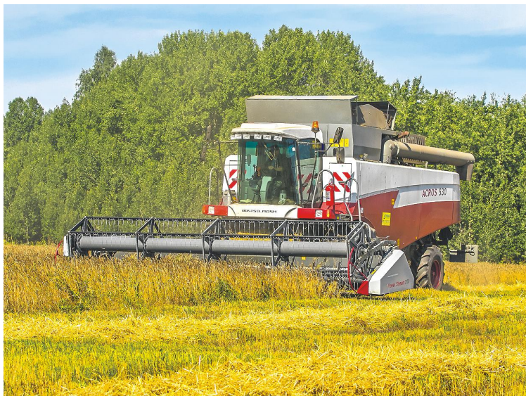
В ЗАО «Скала» Колыванского района и в этом году убранный хороший хлеб.