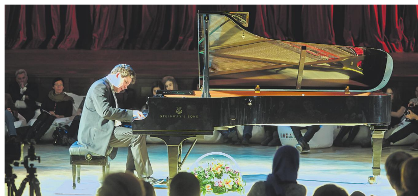
Денис Мацуев, по собственному признанию, чувствовал себя в партере театра, как в кратере вулкана.

Неофициально открыл сезон в сибирском Колизее (сейчас официальное название НГАТОиБ — НОВАТ) 28 октября Денис Мацуев . Народный артист России исполнил избранные произведения Петра Чайковского, Роберта Шумана и Игоря Стравинского. В большом зале театра ещё идут реставрационные работы, в партере нет привычных кресел. Зрителям, а на благотворительный концерт пригласили учащихся музыкальных школ и лицеев, студентов консерватории и творческую интеллигенцию, предложили расположиться в креслах-мешках. Рояль Steinway, который в своё время для театра выбирал сам Мацуев, был установлен в центре партера. И это придало особую атмосферу действу.