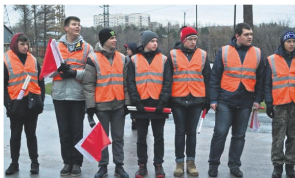
В соревнованиях приняли участие студенты из Новосибирской, Кемеровской областей, Алтайского и Красноярского краёв.

В открытом чемпионате Новосибирской области по автомобильному многоборью среди студентов государственных профессиональных образовательных учреждений «Дорога в будущее — 2015» приняли участие студенты из Новосибирской, Кемеровской областей, Алтайского и Красноярского краёв. Участники соревновались в линейном слаломе, скоростном маневрировании, стрельбе из пневматической винтовки, а также демонстрировали свои знания правил дорожного движения.