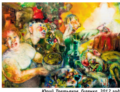
Юрий Третьяков. Гулянка. 2012 год.

Выставка «Акварель. Традиции и современность» работает до 29 ноября.