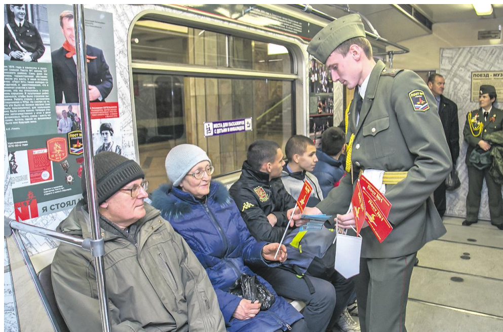
35 млн пассажиров за пять лет существования провёз новосибирский поезд-музей.

— 600 тысяч выездов в год делает скорая помощь и почти в каждой семье новосибирцев бывает, — комментирует значение служ-