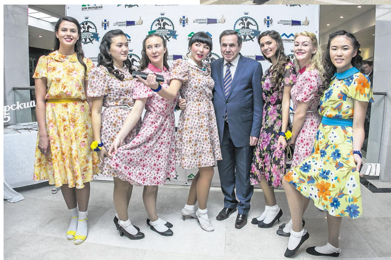
Фото на память с губернатором Владимиром Городецким.

Организаторами Шестого Молодёжного губернаторского бала выступили управление молодёжной политики министерства региональной политики Новосибирской области и государственное бюджетное учреждение Новосибирской области «Дом молодёжи».