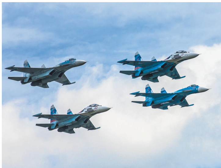
План Новосибирского авиационного завода им. В. П. Чкалова по гособоронзаказу — 16 самолётов Су-34.