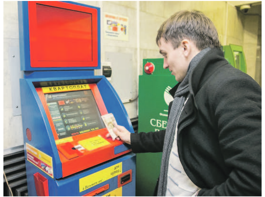
Сотрудники финансовой разведки пресекли несколько схем «обналички» денежных средств через платёжные терминалы.