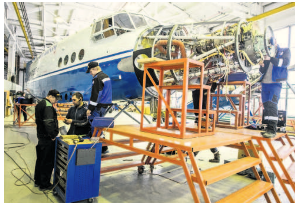
В одном из ближайших номеров «Ведомостей» читайте материал о работе предприятия оборонной промышленности Новосибирской области СибНИА им. Чаплыгина.