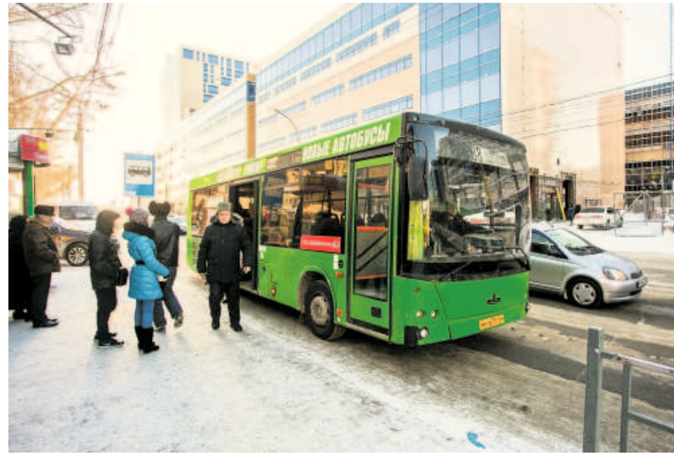
Тарифы на проезд в общественном транспорте пока остаются на прежнем уровне.