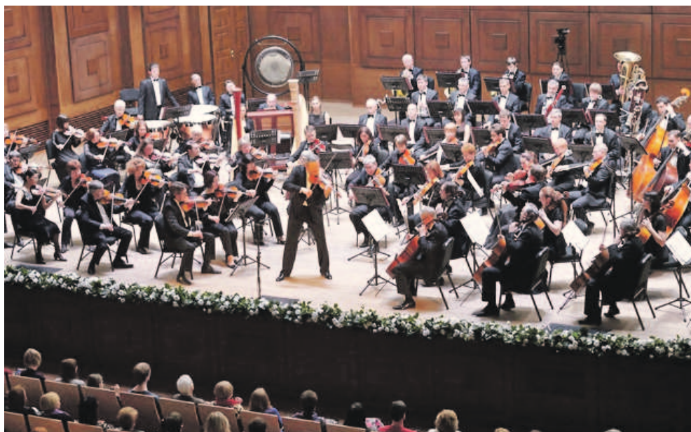
Первый Транссибирский арт-фестиваль. Новосибирский академический симфонический оркестр и Вадим Репин.

Для музыкантов оркестра это будет очередное знакомство с замечательным музыкантом и дирижёром, который перенял дирижёрскую палочку у Ростроповича в Национальном оркестре Вашингтона и много лет его возглавлял, а после стоял во главе очень многих замечательных коллективов на разных континентах. Нас связывает богатая история совместных выступлений. И для меня большая радость, что он в числе наших гостей, — представил музыканта Вадим Репин. — Кстати, Скрипичный концерт Чайковского, заявленный в той же программе, буду исполнять не я, а моя коллега, японская скрипачка Акико Суванан, которая в 1990 году стала победительницей конкурса имени Чайковского. Несколько месяцев назад мы выступа-