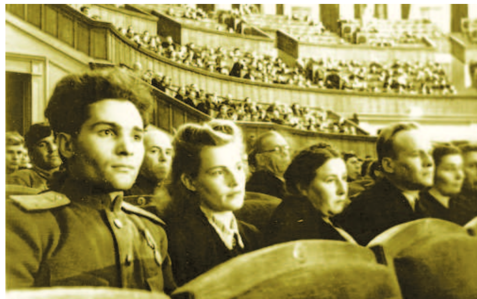
12 мая 1945 года. Опера Глинки «Иван Сусанин».

2. Назовите солисток балета, удостоенных звания «Заслуженный артист России» в декабре 2014 года.