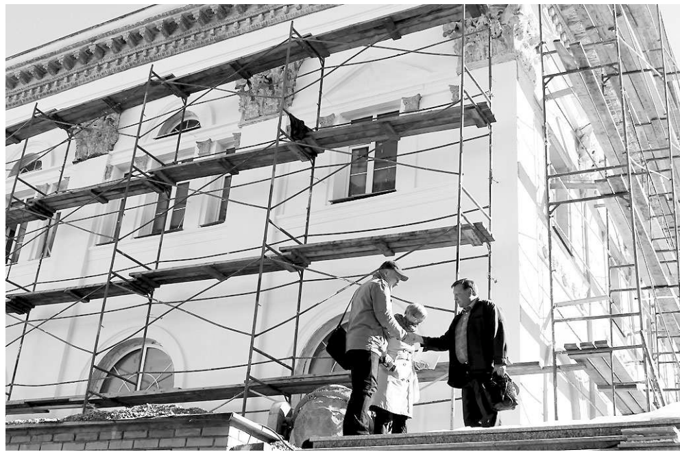
Проводя реконструкцию, строители бережно сохраняют стиль того времени.

Прошлое-будущее уместилось на узком полотне асфальтированной дороги, ведущей