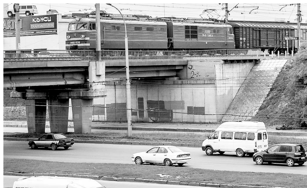
Рельсовый транспорт поможет решить проблему пассажирских перевозок в Новосибирской агломерации.

В него должны войти существующие железные дороги, их дополнит легкорельсовый трамвай (ЛРТ). Метро за границу города никогда не выйдет, а линии ЛРТ, который во много раз дешевле, могут быть продлены до границ агломерации. При этом движение по этому каркасу должно быть более интенсивным, с периодом в 15–20 минут и на основе более комфортного подвижного состава. Возможно, тогда и на автодорогах станет свободнее и безопаснее?