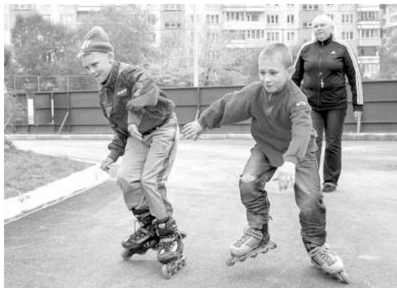
Ролики — одно из любимых увлечений мальчишек из «Созвездия».

И это желание подростка может сбыться. Его мама делает всё, чтобы восстановиться в родительских правах.