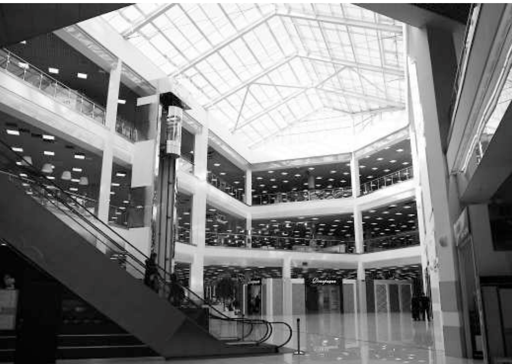
Торгово-выставочный комплекс «Калейдоскоп».

Группа компаний «Строительный век» предлагает клиентам полный спектр строительных работ и услуг. Мы выполняем функции заказчика-генподрядчика в строительстве. Сюда включаются