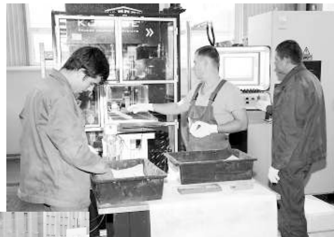
Новосибирцы смогут побывать в цехах завода «НЭВЗ-Керамикс» и на 15 других площадках, участвующих в акции «Дни без турникетов».

Программа мероприятий будет направлена преимущественно на подрастающее поколение: