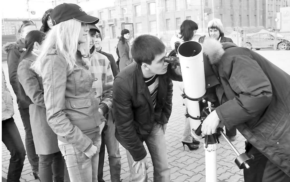
Любой желающий сможет посмотреть на Солнце через телескоп на площадке перед зданием ГКЗ, организованной ДЮЦ «Планетарий».

Ирина ТИМОФЕЕВА