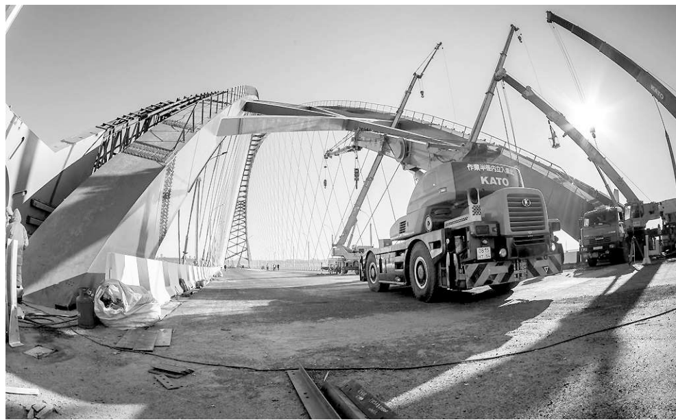
До открытия Бугринского моста остались считанные дни.

По данным ГКУ «Территориальное управление автомобильных дорог Новосибирской области» (ТУАД), бюджетные ассигнования на дорожное хозяйство Новосибирской области в 2014 году составляют 8,9 млрд рублей. Это чуть выше уровня 2009 года (8,6 млрд рублей), а рекордным в последние годы был 2011-й — 13,5 млрд рублей. В прошлом году дорожникам было выделено 12,5 млрд. В основном это — средства областного бюджета.