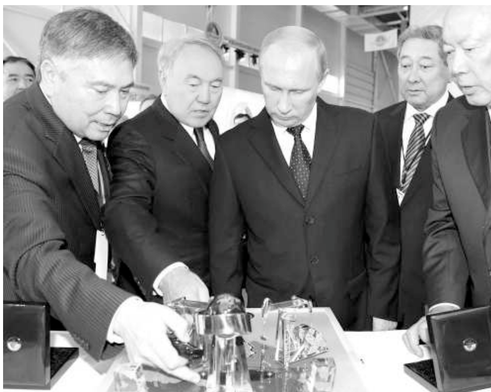
Президенты двух государств посетили выставку «Инновации в углеводородной сфере», в которой приняли участие около 60 казахстанских и российских компаний.