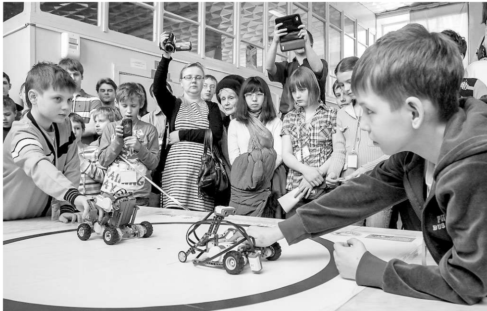
Все три дня в ГКЗ будет работать выставка моделей различных робототехнических конструкций, собранных школьниками, студентами и инженерами «Лиги роботов».

Подобным способом на заводе изготавливаются и бронекерамика.