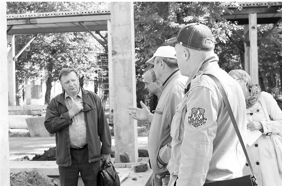
Здесь будет бассейн с карачинской минеральной водой, водные горки.