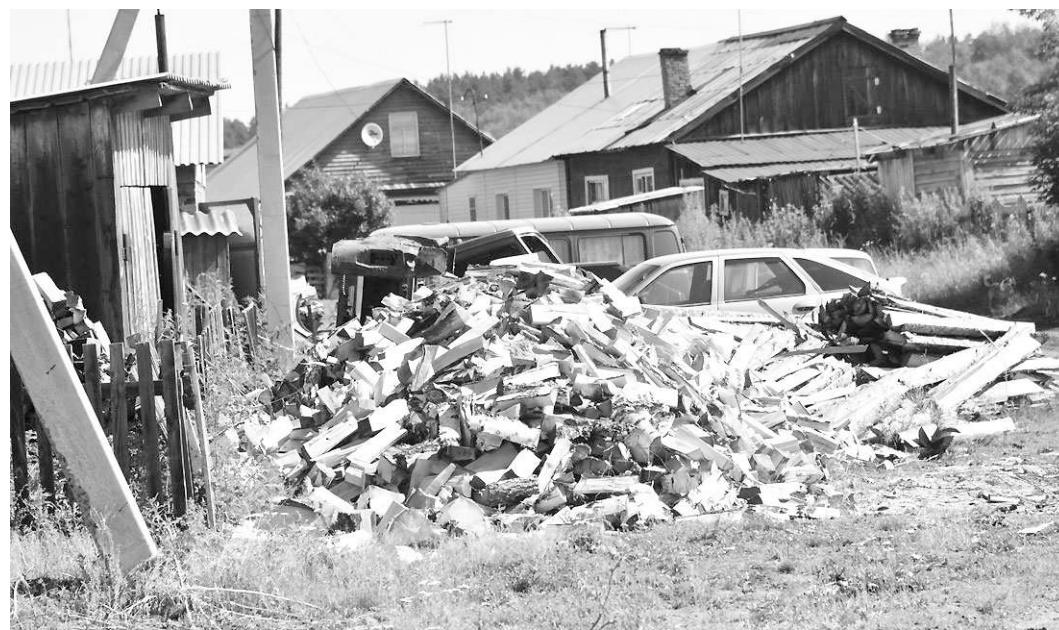
Сегодня предприниматели доставляют дрова жителям по первому звонку.

«За четыре месяца рабочая группа, в которую вошли и депутаты, сделала многое. Мы смогли обеспечить население дровами, дали возможность работать предпринимателям в лесу. Теперь надо, чтобы и на 2015 год каждый глава района и поселения знал, какой лимит древесины он получит. Необходимы поправки в 130-й закон, регламентирующий обеспечение граждан древесиной».