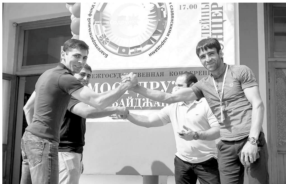
Сегодня азербайджанские диаспоры есть во всех городах Сибири.