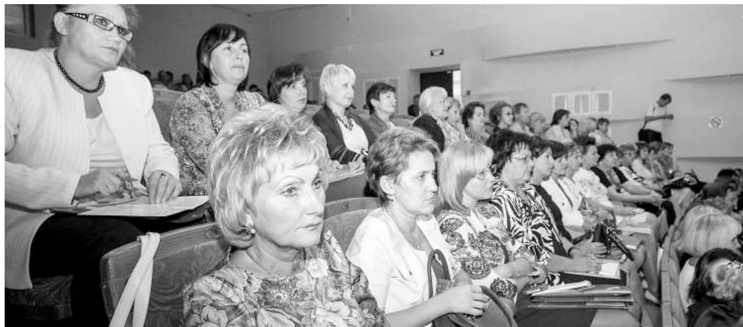
По мнению экспертов, определить компетенцию педагогов поможет специальный профессиональный экзамен.

Учиться, чтобы хорошо учить. Так можно определить лейтмотив большого педсовета, прошедшего в конце минувшей недели на разных дискуссионных площадках Новосибирска. Конференции, деловые встречи завершились пленарным заседанием — XIV съездом работников образования Новосибирской области.