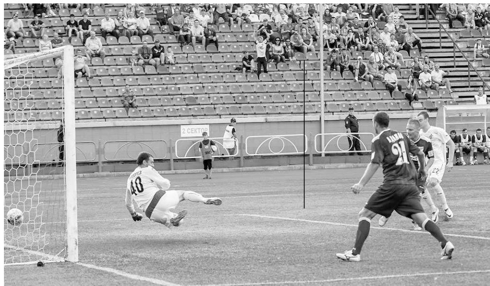
24.08.2014 г. «Сибирь» — «СКА-Энергия». Хозяева забивают первый гол.