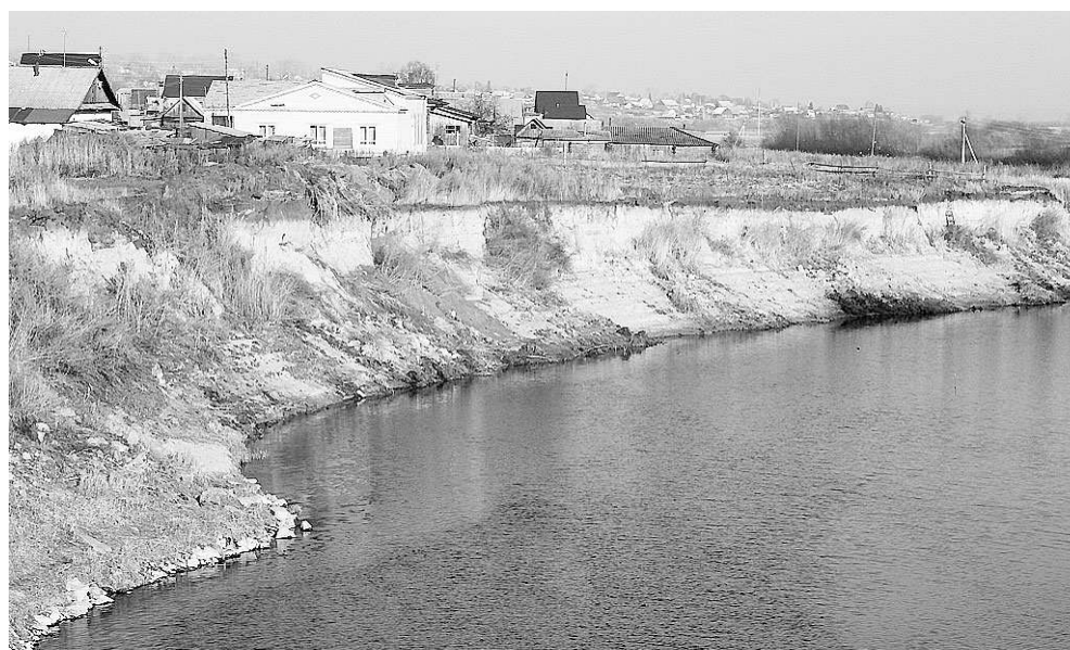
В рамках госпрограммы НСО «Охрана окружающей среды» в 2015—2020 годах планируется выделить 3 млрд 171 млн рублей. Из них 2 млрд 30 млн — цена берегоукрепительных работ на протяжении 2 км 600 м в границах Новосибирска.

Депутат Александр Морозов заявил, что никакого бюджета не хватает, чтобы эти берега защитить. Но если разделить берег на участки и пригласить бизнес, то он поможет решить задачу совместно с государством. От наступления моря страдают пригородные районы, Новосибирский, Искитимский, Ордынский и частично