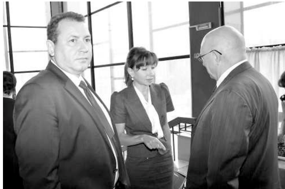
Врио первого замгубернатора НСО Анатолий Соболев , врио министра юстиции Наталья Омелёхина и врио министра соцразвития Сергей Пыхтин .

Территории Новосибирской агломерации будут объектом особого внимания первых лиц области.