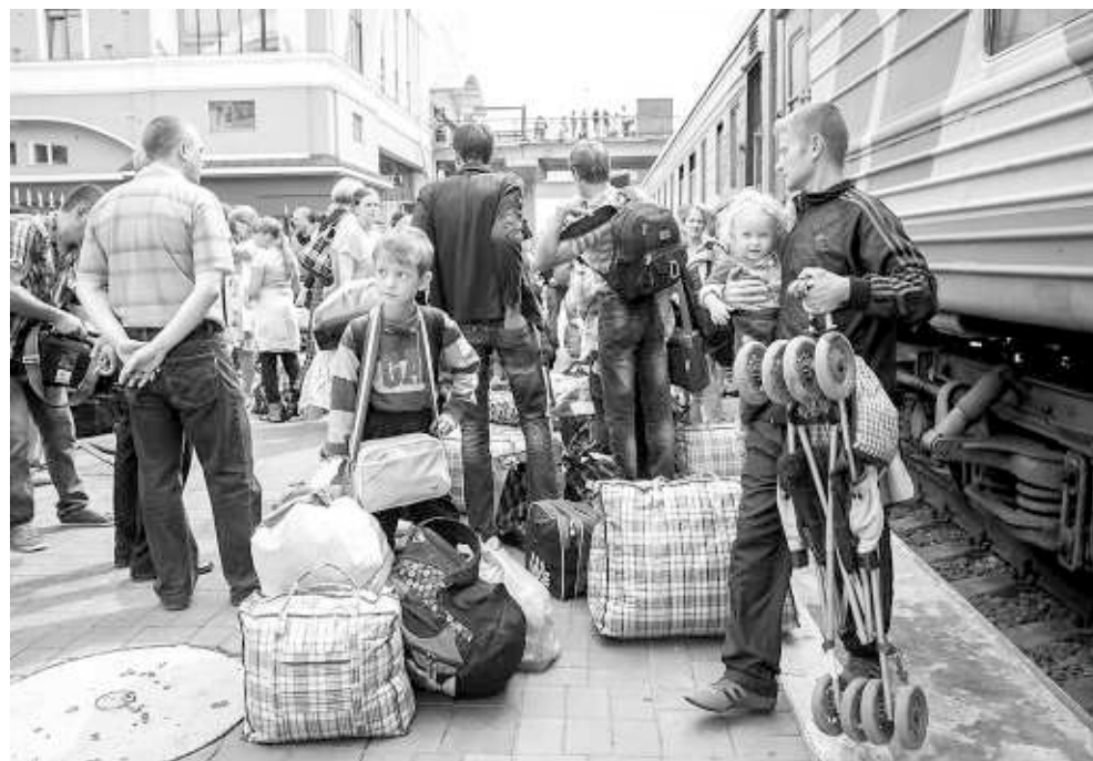
На территории области создано 17 пунктов временного размещения беженцев.

По словам врио главы региона, сейчас в области открыто более семи тысяч рабочих вакансий, этого вполне достаточно, чтобы трудоустроить всех приезжих. Часть украинцев уже нашли себе место работы. Холдинговая компания «НЭВЗ-Союз» отобрала 68 человек и разместила в своих общежитиях. Завод «Электросигнал» пригласил к себе 36 человек.