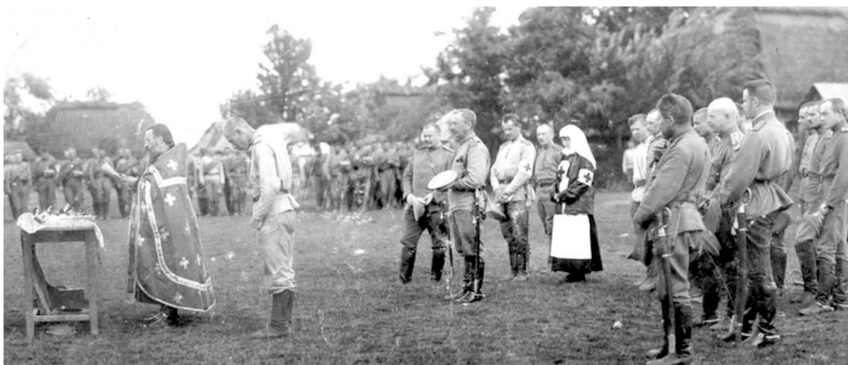
Молебен по случаю награждения Георгиевскими крестами.

К началу Русско-японской войны остановочный пункт в Новониколаевске оказался очень кстати. Первые месяцы все войска Сибирского военного округа, в том числе резервные, были направлены для формирования частей, отправляемых в Китай. Именно здесь, в казармах, шла основная мобилизация; за 1904 год было призвано 160 тысяч запасных солдат. Других округов мобилизация