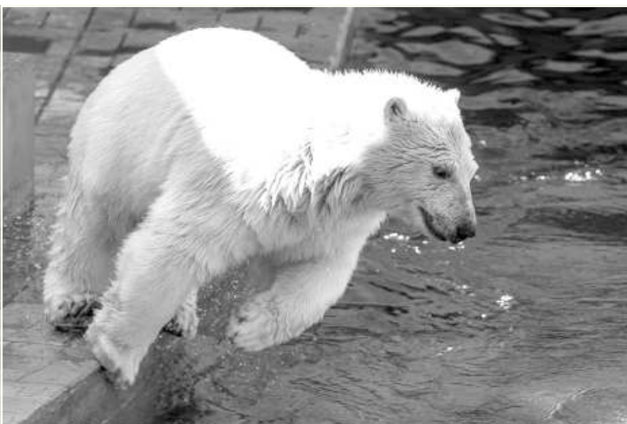
«Звездой» зоопарка с момента своего рождения остаётся медведица Шилка.