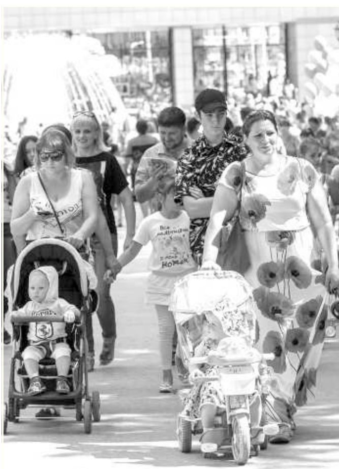
Количество семей с колясками поражало воображение.