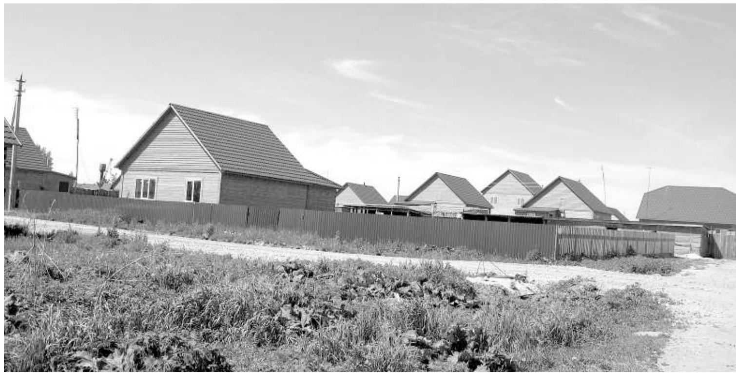
Новые дома Скалы, построенные с помощью госпрограммы.