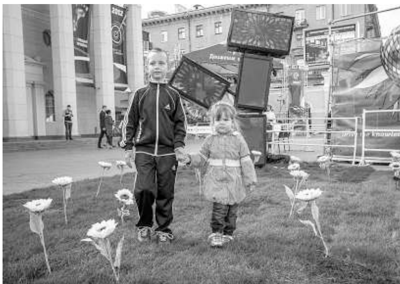
Международный молодёжный инновационный форум «Интерра» проходил в Новосибирске пять лет подряд.