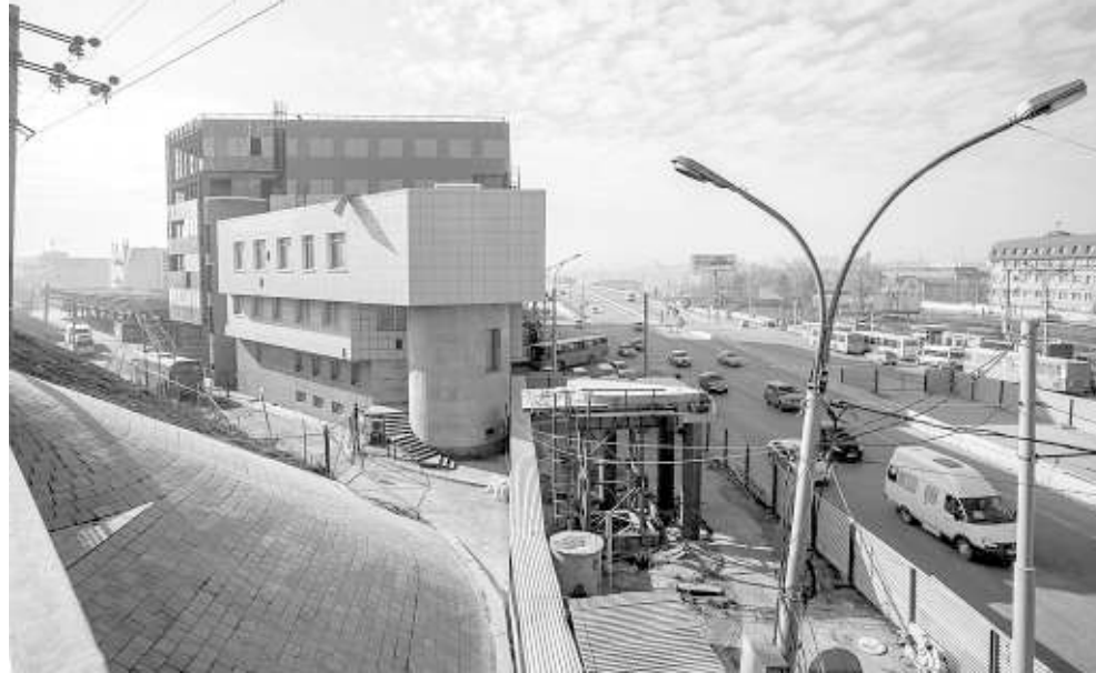
Чтобы завершить здание автовокзала, город обязуется вложить 70 млн руб., а 127 млн должны доплатить инвесторы.