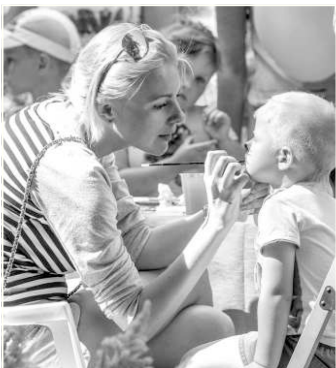
Сейчас ты станешь котёнком...