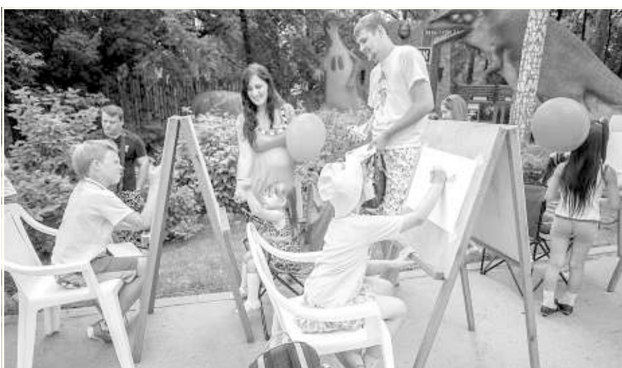
Нарисую маму, нарисую папу и себя не забуду.

Праздник в зоопарке в начале августа для малышей и их родителей отныне станет новой городской традицией.