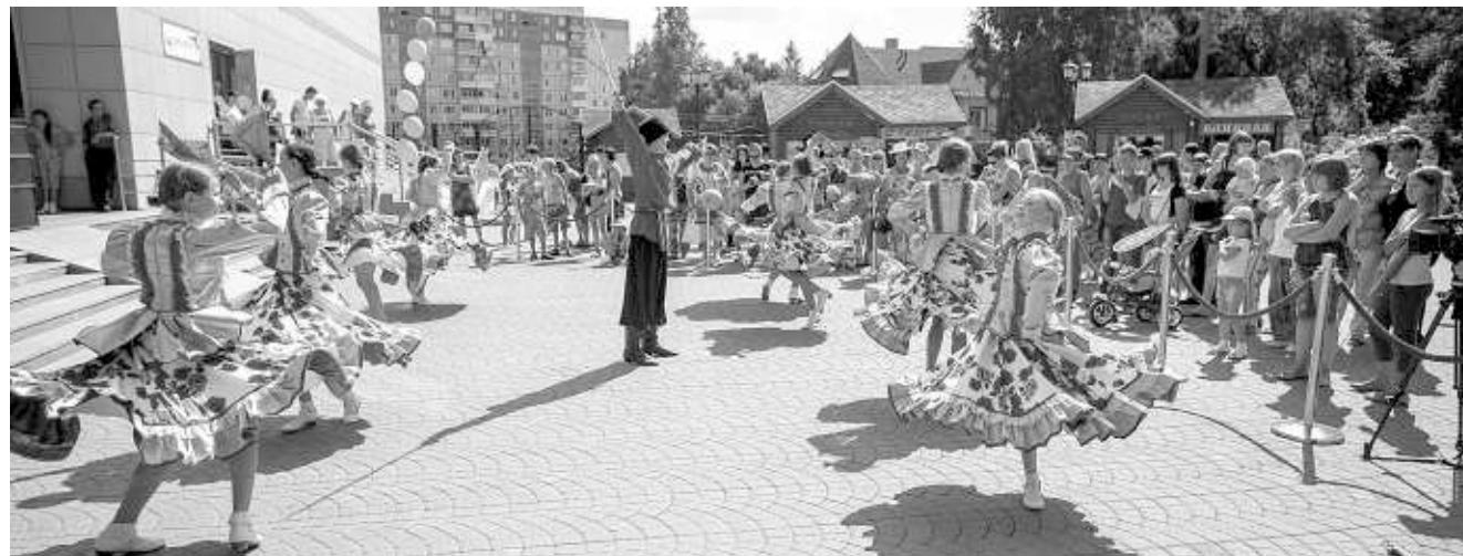
И концерт посмотреть, и приз выиграть. В этот день было возможно почти всё.