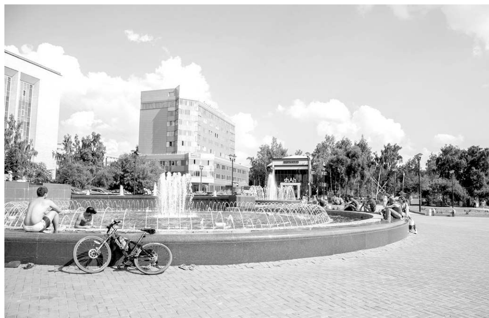
По словам мэра, «МакДональдс» в сквере возле ГПНТБ строиться не будет.

Сказать, что я во всём до тонкостей разобрался, нельзя будет до самого окончания срока полномочий. Новосибирск — очень большой город, есть множество разных нюансов. Если я решу, что уже всё знаю и всё могу, это значит остановиться в своём развитии. Всегда возникают новые задачи, которые необходимо решать.