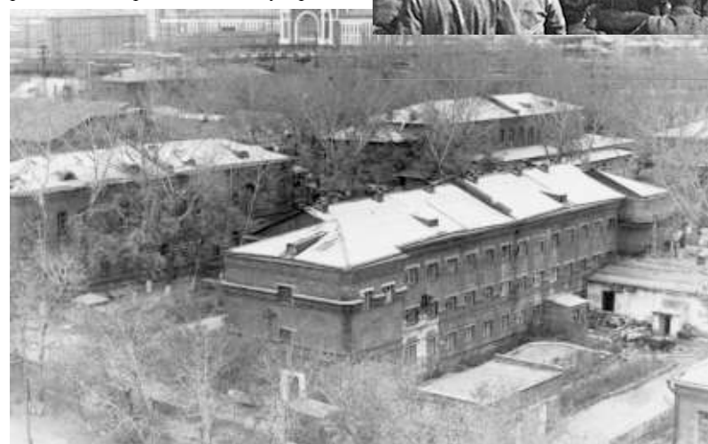
В годы Великой Отечественной войны здесь располагался эвакуированный из Ленинграда приборостроительный завод.

завод, долгое время снабжавший русских солдат на войне сухарями из алтайской пшеницы.