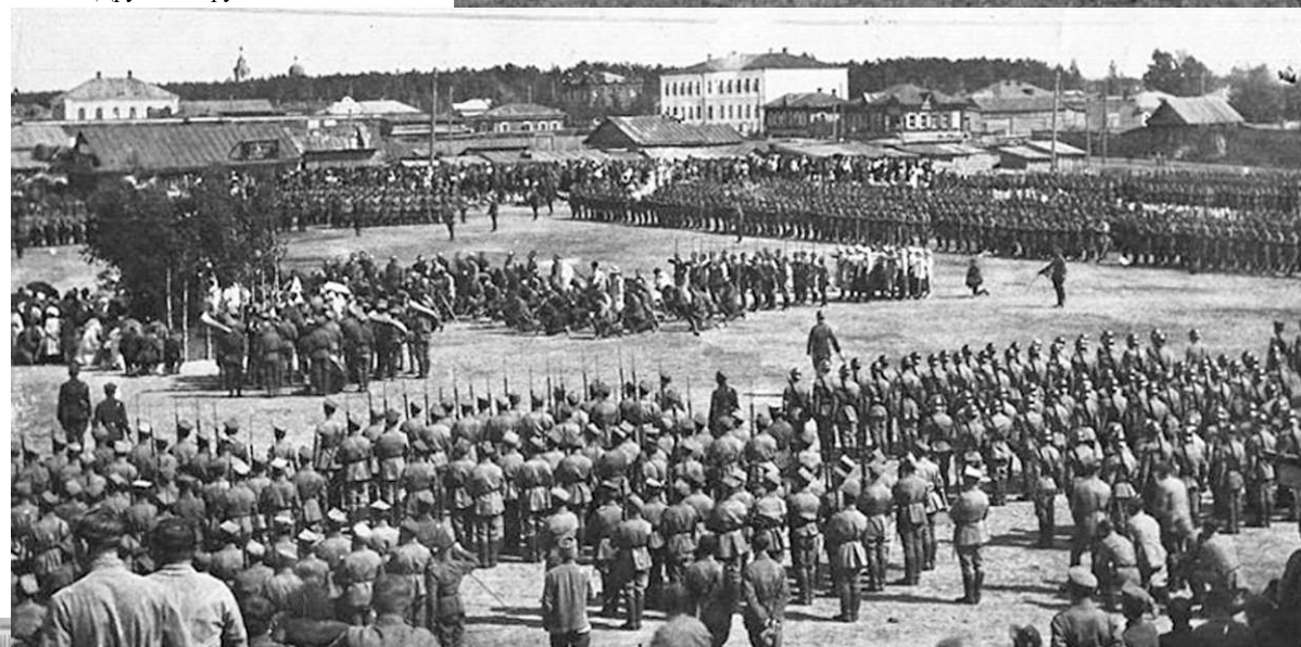
Парад по случаю годовщины Грюнвальдской битвы в Новониколаевске. 1919 г.