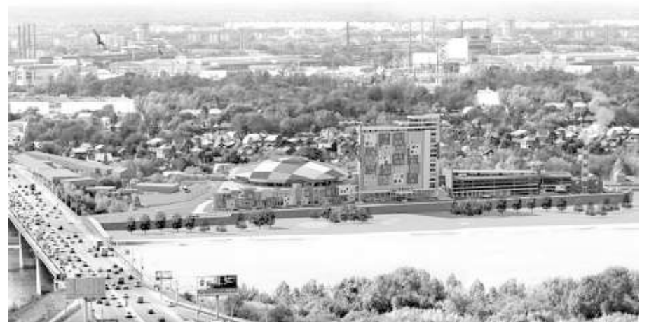
Проект аквапарка: вид с правого берега, со стороны Димитровского моста (иллюстрация с официального сайта ГК «Кварсис» www.kvarsys.ru ).