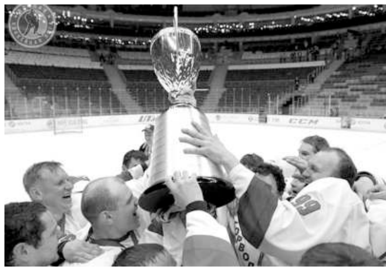
Вот он, Кубок Мечты!

Это событие осталось в нашем городе практически незамеченным. А между тем, новосибирская команда по хоккею стала в начале мая чемпионом России по хоккею!