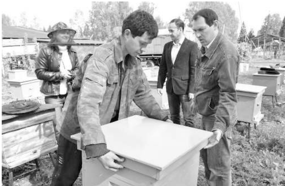
Учебная пасека лицей способна давать до полутора-двух тонн мёда ежегодно.

Со временем учебное заведение обрело свои современные контуры: в 50-е годы в связи со строительством Новосибирской ГЭС здание школы было перенесено из зоны затопления на территорию опытной станции им. Мичурина в посёлок Агролес. А в конце 60-х закончилось строительство ныне существующих учебных и лабораторных корпусов, общежития и котель-