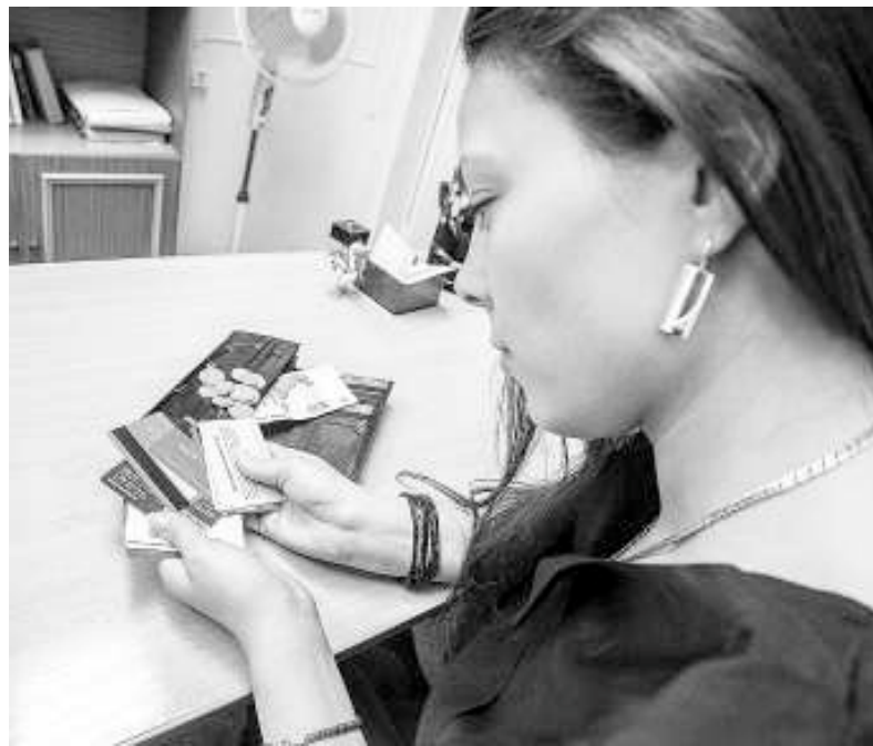
К концу года уровень просроченных кредитов россиян увеличится до 17,5%.

Правовые изменения ждут и другие секторы финансового рынка. Как рассказал «Российской газете» зам-председателя комитета Государственной думы по финансовому рынку Анатолий Аксаков, предстоит усовершенствовать закон о бюро кредитных историй. За время его работы в таких бюро накопились десятки миллионов сообщений, и в целом закон работает эффективно. Однако мошенники продолжают активно орудовать на рынке, несмотря на имеющуюся информацию об их недобросовестной деятельности. Необходимо улучшить механизмы предоставления информации в бюро и сделать её использование более эффективным, отметил Аксаков.