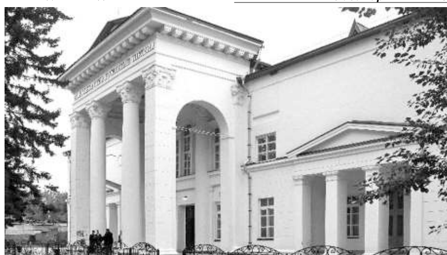
Спроектированный Ащепковым Дом офицеров в городе Оби, ныне Новосибирский богословский институт.