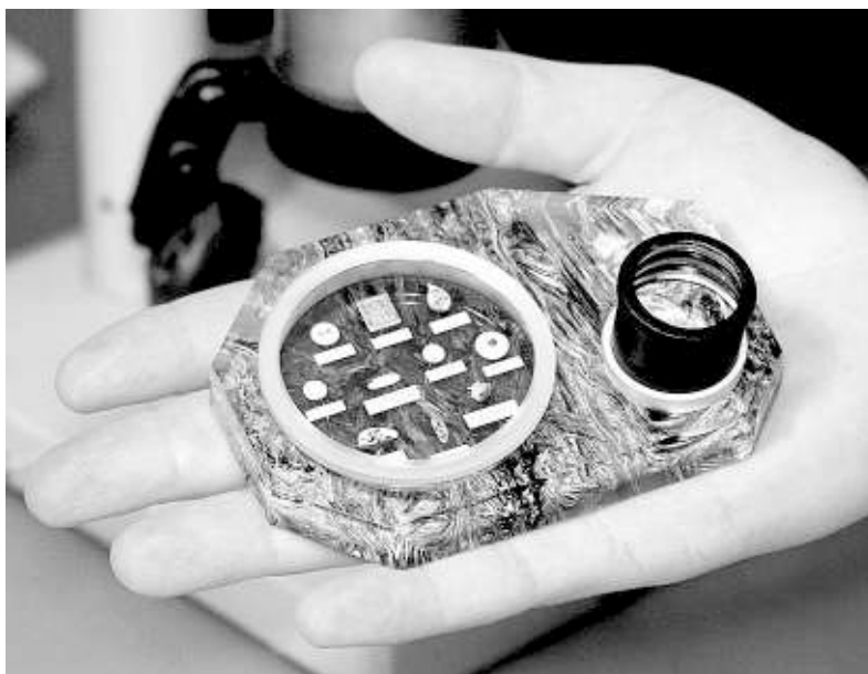
Космический музей представляет собой пластину чарюита 107x73 мм, на которой закреплена кварцевая пластина толщиной 8 мм. Кварцевая пластина имеет два отверстия. В большое отверстие помещена стеклянная пластина синего цвета, на которой расположены 10 микроминиатюр. Во второе отверстие вставлено увеличительное стекло. Вес космического музея составляет 234 г.

— Я к неудачам привык, это рабочие моменты, на которые не стоит обращать внимание, — говорит Анискин. — Бывает, что работа «не