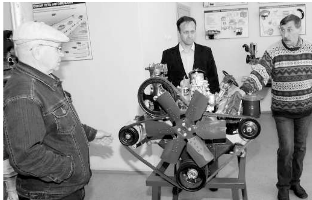
Современный пчеловод должен хорошо разбираться в технике и освоить вождение трактора.