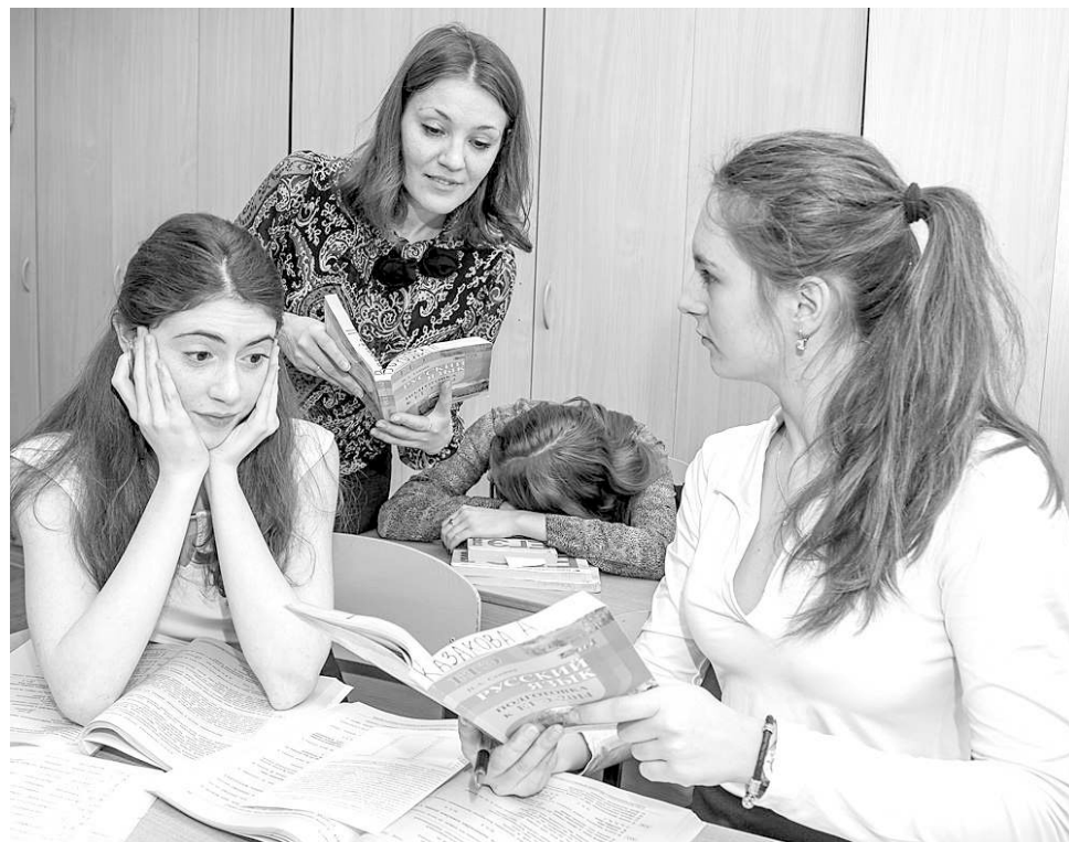
Будущие абитуриенты в раздумьях: на какой вуз удастся набрать баллов?

В академии один из самых низких в городе средний балл ЕГЭ за один экзамен — 54,4, и минимальный конкурс — от 1,07 до 1,4 заявления на место. Стоимость обучения на коммерческой основе — 30—37 тысяч рублей за семестр.