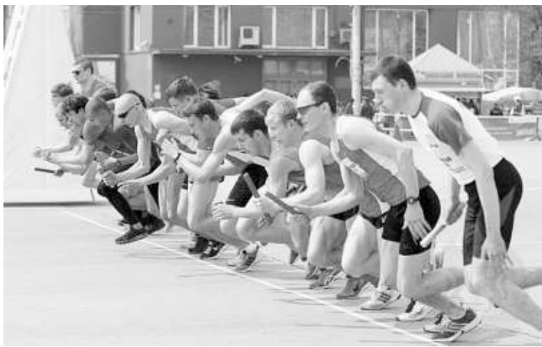
Старт первого забега.

— Желаю вам сегодня на этой прекрасной площадке показать свои способности, результаты и способности наши новосибирские традиции, которые зарождались долгие годы. Именно здесь, на этих дистанциях, рождались олимпийские чемпионы, такие, как Виктор Маркин, Андрей Перлов и многие другие. Думаю, что сего-