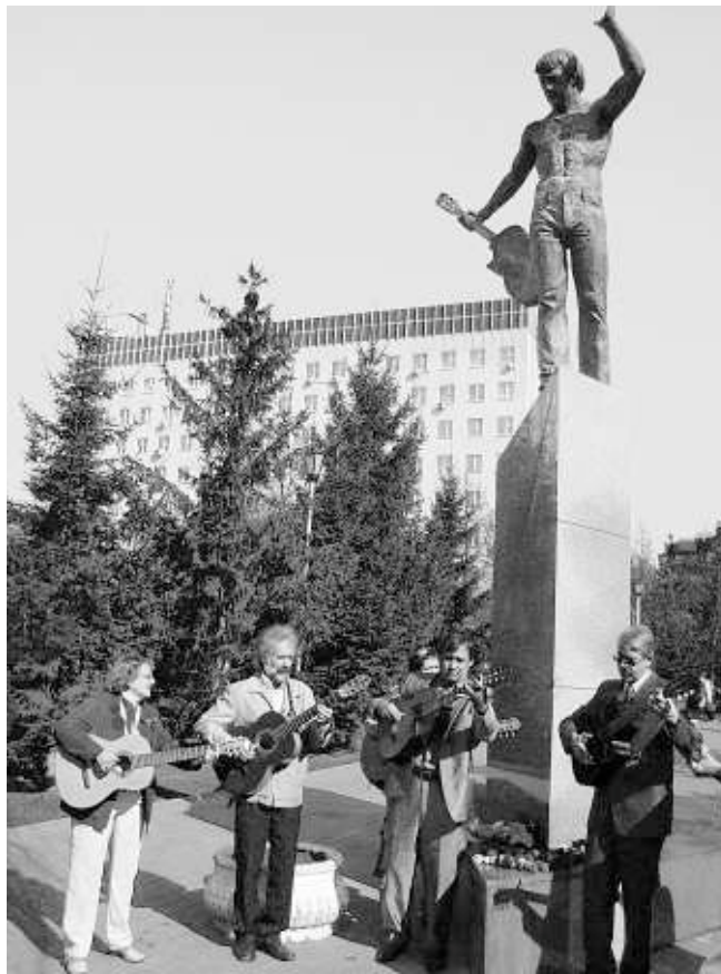
И снова у памятника Высоцкому звучат песни поэта.

— У нас в Болгарии Высоцкого хорошо знают и любят ещё с советских времен, — сказал