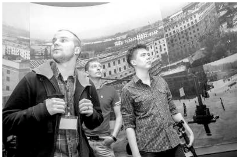
В 2013 году Ночь музеев собрала около 22 тысяч человек.

В Городском центре истории новосибирской книги (ул. Ленина, 32) смешают Пушкина и джаз, устроят книжный аукцион и подготовят выставку графики петербуржца Энгеля Насибулина «Читал охотно Апулея...». Городской центр изобразительных искусств (ул. Свердлова, 13) планирует устроить «Ночь Японии»: в программе — выставка японских кукол и фотовыставка «Моя Япония», мастер-класс по искусству бонсай, каллиграфии и оригами. Музей Н. К. Рериха (ул. Коммунистическая, 38) ждёт на мастер-класс по урало-сибирской росписи, а Музей истории народов Сибири и Дальнего Востока СО РАН (ул. Золотогорная, 4) — по изготовлению каменных орудий и древнему ткачеству. В Новосибирском музее мировой погребальной культуры (село Каменка, ул. Военный