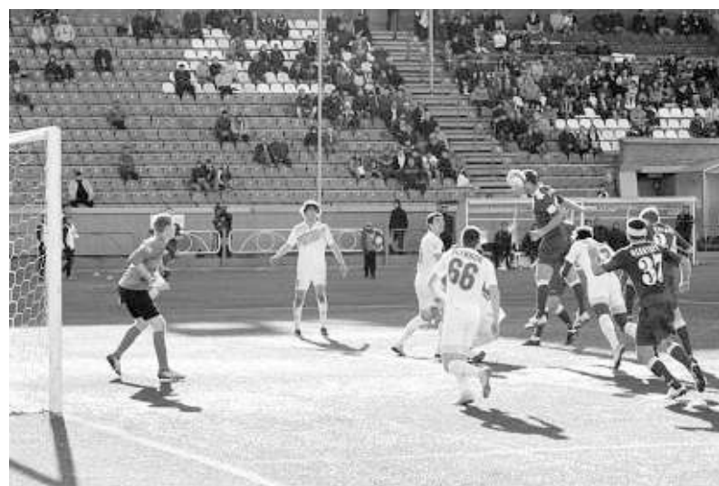
11.05.2014. «Сибирь» — «Ротор». Редкая атака «Сибиряк» во втором тайме.

Однако есть замечания и по концовке чемпионата. Считаю, что в двух последних домашних играх первенства «Сибирь» выступила ниже своих уже нынешних возможностей, сыграв оба раза вничью. И если результат встречи с крепким владивостокским клубом «Луч-Энергия», претендовавшим на стыковые матчи с командами премьер-лиги, можно отнести к удовлетворительным, то последнюю домашнюю игру с волгоградским «Ротором», судорожно барахтающимся в подвале турнирной таблицы, явно нельзя занести себе в актив. Настораживает и общая тенденция течения матчей: в обеих играх «Сибирь» бод-