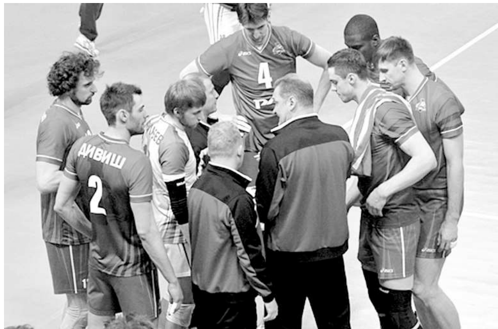
Серебряные лауреаты чемпионата страны волейболисты «Локомотива». Рабочая планёрка.

После «Зенита» «всухую» была бита «Губерния». Жёсткий полуфинал с московским «Динамо» был полон страсти, нервов и борьбы.