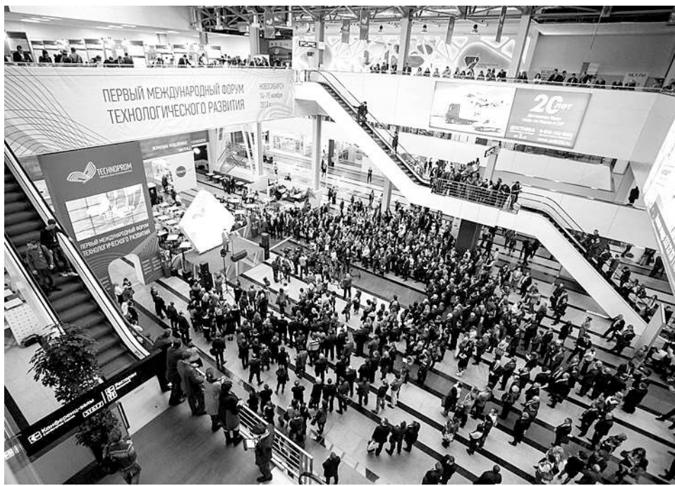
Целью форума как международной деловой площадки является создание новых партнёрских отношений в сфере высоких технологий между представителями науки, бизнеса и власти.