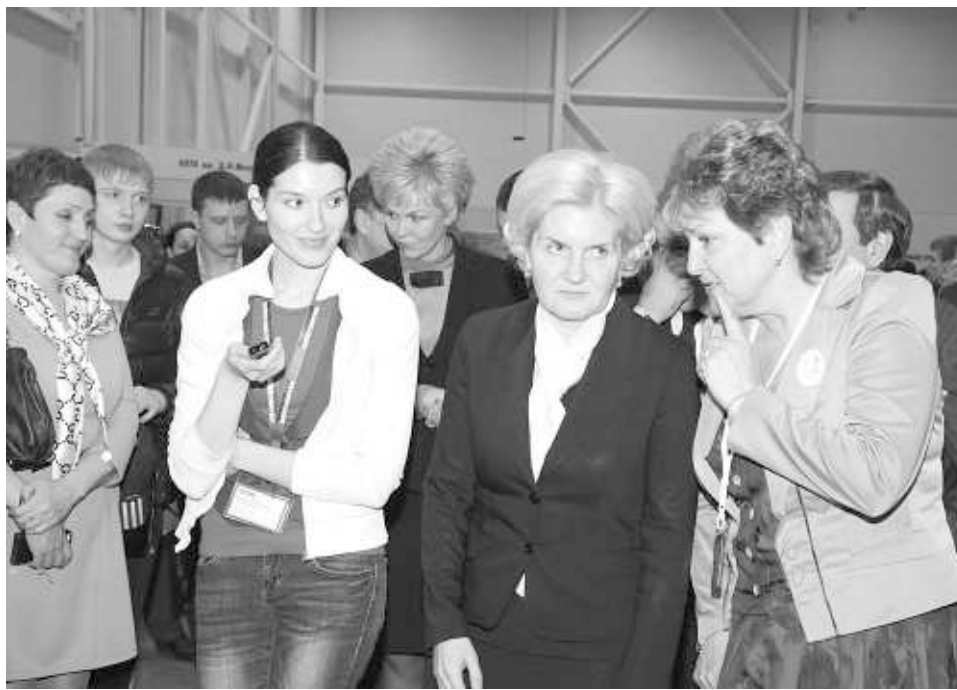
Ольга Голодец на открытии чемпионата рабочих профессий в «Новосибирск-Экспоцентре».