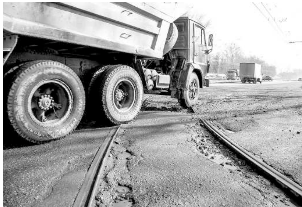
В апреле планируется отремонтировать 67 920 квадратных метров дорожного полотна.

В Новосибирске проходит сезонный ремонт магистралей, который должен завершиться к 1 мая.