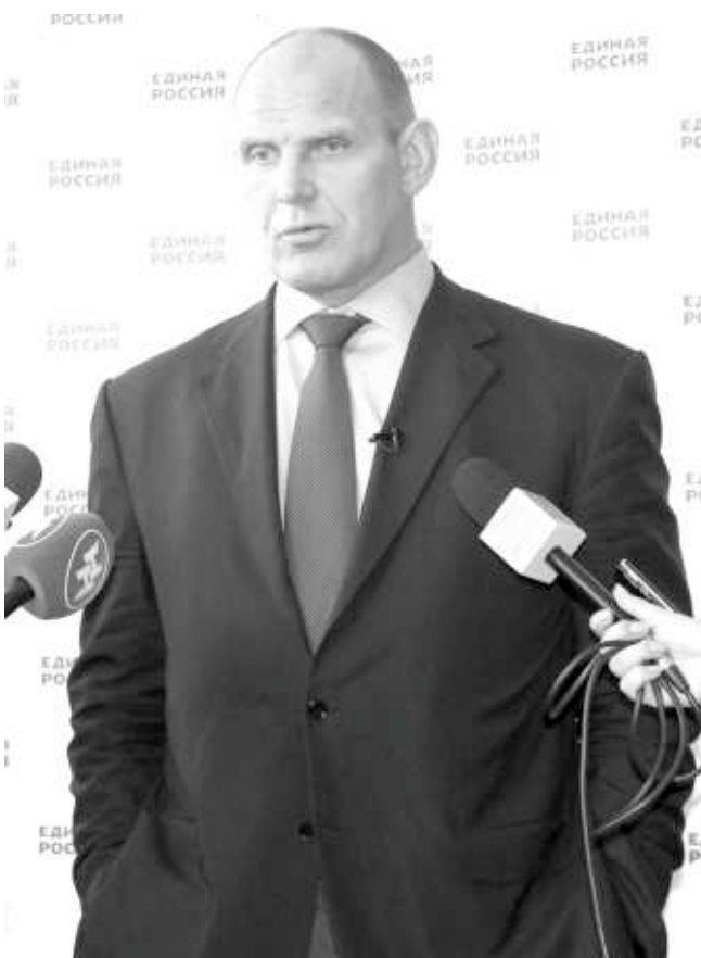
Александр Карелин: «Не думайте о том, что за вас всё решено».

На просьбу дать напутствие избирателям трёхкратный олимпийский чемпион ответил так: