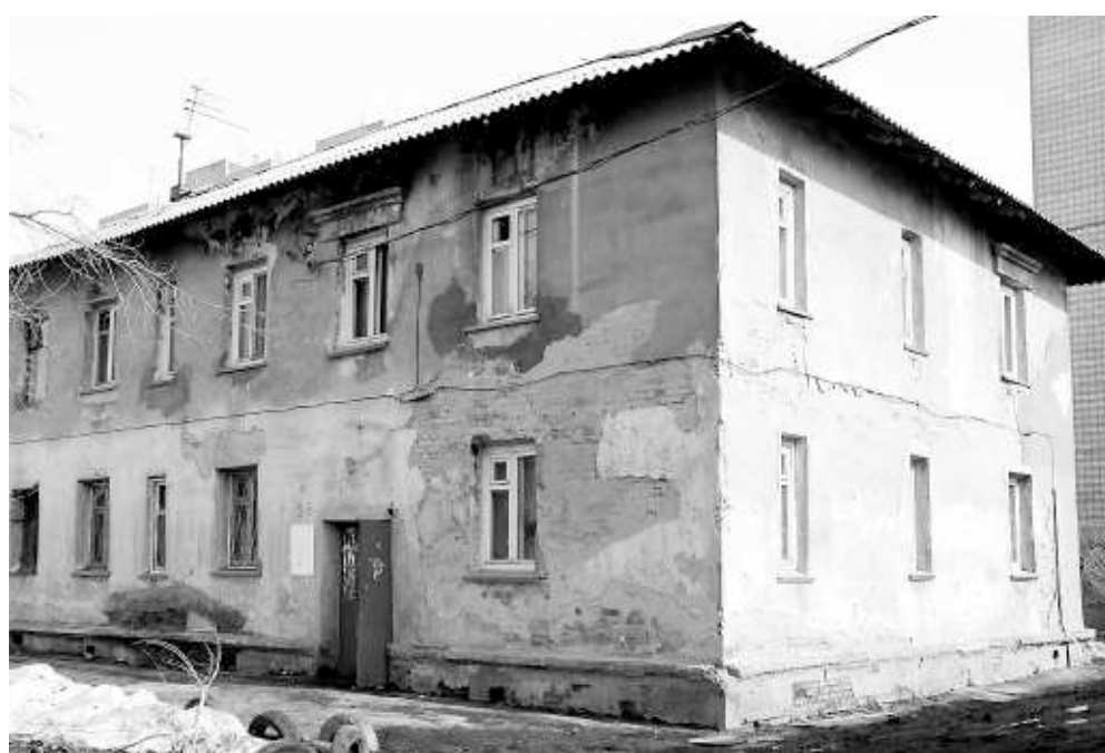
С 2004 года в Новосибирске было расселено и снесено около 260 ветхих и аварийных домов.