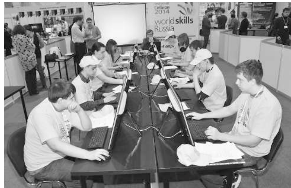
Лучшие молодые вебдизайнеры и кондитеры, парикмахеры и косметологи, фрезеровщики и токари представляют Сибирь на финале WorldSkills Russia.

— Здесь мы определяем содержание нитратов во фруктах и овощах. Прибор очень прост в использовании: два электрода опускаются в раствор, в данном случае, яблок —