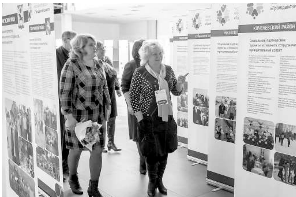
На форуме были представлены проекты, которые реализуются в районах области.

В Новосибирской области — более 4,5 тысячи некоммерческих общественных организаций. В них работает восемь тысяч сотрудников, а также добровольцев и волонтеров. В двадцати районах области и десяти районах Новосибирска действуют ресурсные центры.