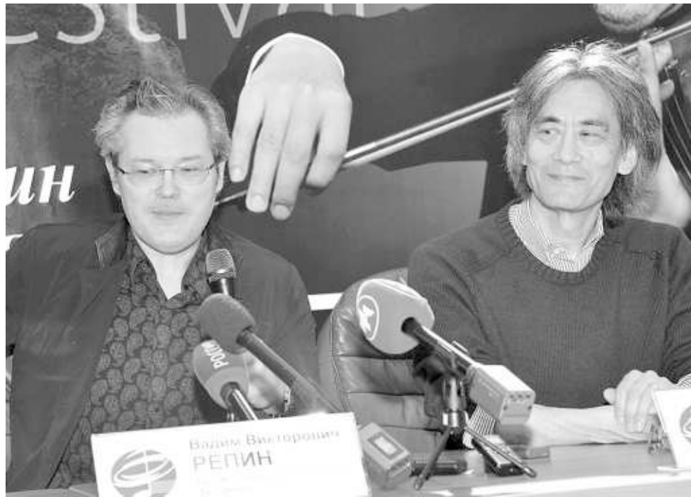
Вадим Репин и Кент Нагано работают вместе уже 23 года.

Транссибирский арт-фестиваль проводится Новосибирской государственной филармонией и Фондом Вадима Репина при поддержке губернатора и правительства Новосибирской области. Заключительный концерт пройдёт 12 апреля в ГКЗ имени Арнольда Каца: в этот день Новосибирский академический симфонический оркестр исполнит произведения Шостаковича и Чайковского, а за дирижёрский пульт встанет маэстро Валерий Гергиев.