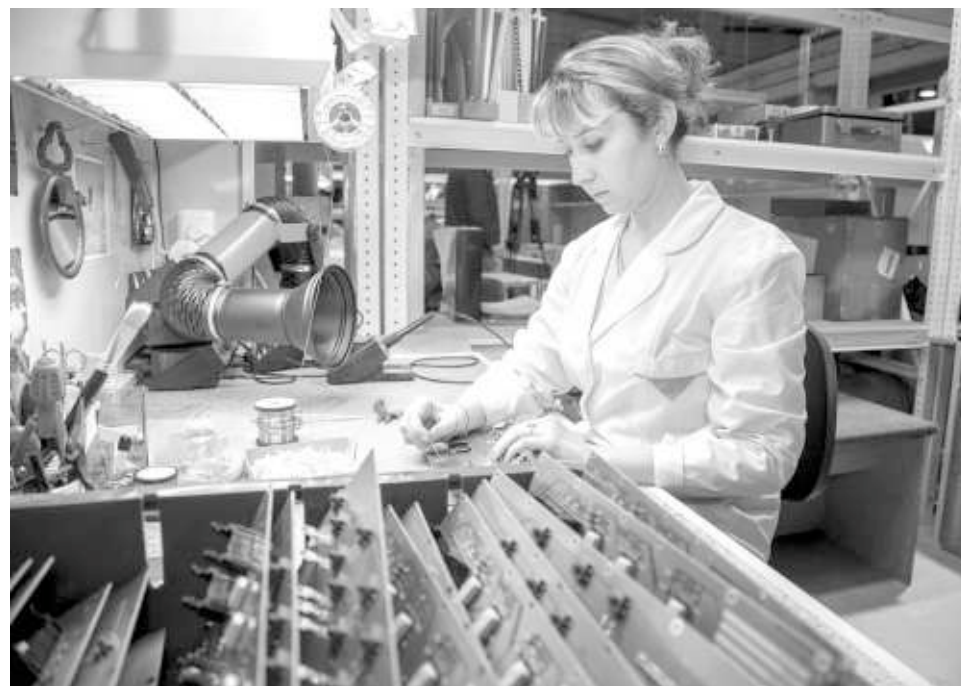
Около 80 процентов продукции «Триада-ТВ» выпускает по госзаказу.

Вчера в Новосибирске открылась новая производственная площадка завода «Триада-ТВ».